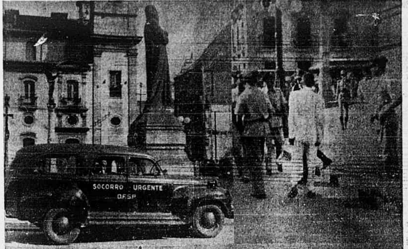
Depois de evacuadas as galerias do Palácio Tiradentes, em virtude das manifestações ocorridas na sessão de ontem, populares se reúnem em numerosos grupos em frente às escadarias da Câmara, comentando a medida adotada pela mesa. Detachado da tradição parlamentar de qualquer país. De fato, o povo que é o primeiro interessado na soberania da Constituinte deve saber que somente aos seus delegados é dado manifestar-se na Assembleia que eleger para elaborar nossa lei básica, a Constituição de 1946. Vemos no clichê ao alto, a Polícia Especial — passmem todos! — que continua em plena atividade e o tristemente famoso Socorro Urgente, formando um chocante contraste com a estátua de Tiradentes, defensor da liberdade do povo

Realizou-se ontem, sob a presidência do sr. Melo Viana, a segunda sessão da Assembleia Nacional Constituinte. Como das vezes anteriores, grande foi o interesse popular em assistir a esta sessão. Os trabalhos parlamentares, tanto nesta como nas tribunas esportivas da galeria do Palácio Tiradentes se achavam repletos.