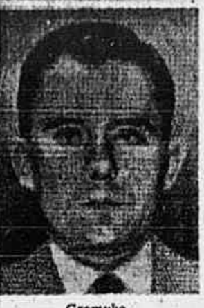
Gromyko sinceros e honestos do mundo uma simples discussão da proposta uruguaia, no sentido de

Seria esquecer as atrocidades praticadas por esses monstros LONDRES, 6 (U. P.) — O ministro do Exterior da Grã-Bretanha, senhor Ernest Bevin, aceitou a formula apresentada pelo delegado soviético junto à Organização das Nações Unidas, senhor Vishinski, para solução do caso criado pela declaração soviética relativa à permanência de tropas britânicas na Grécia. DEVEM PAGAR COM A VIDA OS CRIMINOSOS NAZISTAS LONDRES, 6 (U. P.) — O delegado soviético senhor André I. Gromyko, declarou hoje firmemente que os criminosos de guerra que agora estão sendo julgados em Nuremberg estavam prestes a pagar com suas vidas, embora defendidos. Em seguida, Gromyko denunciou como "um insulto aos povos