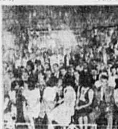
Em Belo Horizonte, os bancários em greve estão reunidos em sessão permanente.