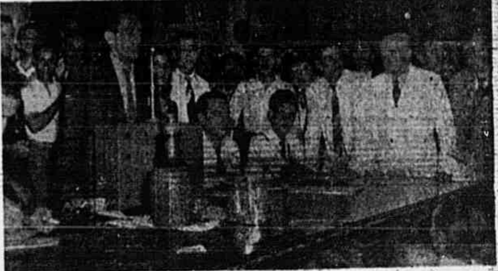
Ao findar o décimo-quarto dia de greve, com a mesma firmeza e determinação com que iniciaram seu justo movimento reivindicatório, os bancários deliberaram proseguir lutando pela sua causa. A classe dos bancários, tão bem representada no governo pelos titulares da Fazenda e do Trabalho, sofreu, ontem, através de um decreto firmado em três parágrafos, mais um golpe contra os bancários. Mas a justiça de sua causa e a solidariedade do povo lhes dão animo sempre renovado para proseguir até à vitória, sem fechar a porta, entretanto, a negociações baseadas num critério decente, a fim de encontrar uma solução equitativa para o caso.

Fogem os banqueiros a qualquer acordo — A entrevista com o Ministro do Trabalho e as demarches com elementos do Sindicato dos Bancos — Firmes os bancários em seus propósitos — "Não voltaremos indignos da classe trabalhadora" — Forças ocultas que procuram criar dificuldades ao novo Governo — Falam representantes da U.D.N. na assembleia dos bancários — O apoio do povo e as numerosas doações