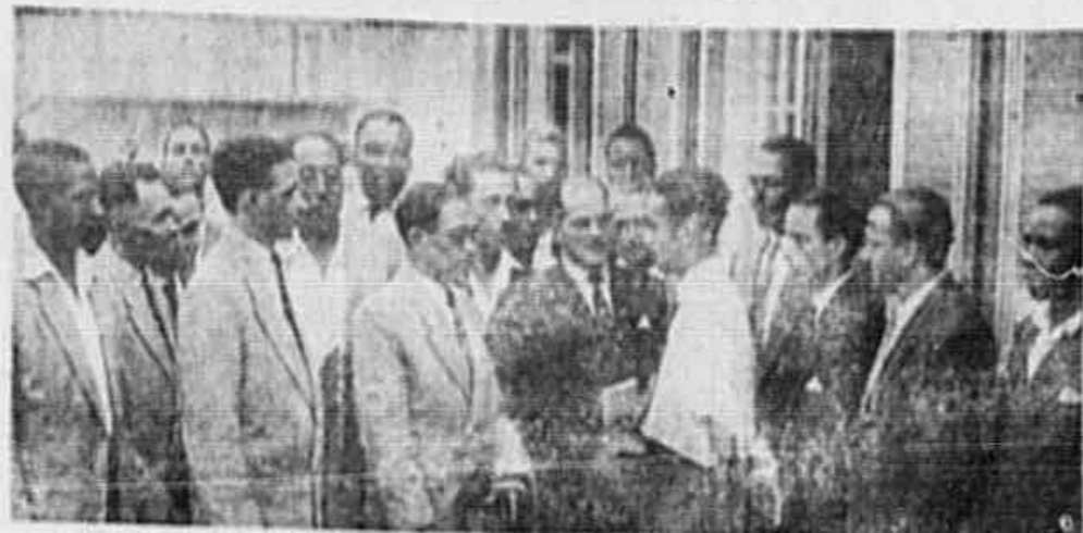
Os trabalhadores da Brahma, em nossa reunião

Companheiros! A Federação Nacional dos Marinheiros, leva ao conhecimento de todos os marinheiros o reajustamento do salário aprovado pelo Conselho Administrativo da Federação Nacional dos Marinheiros, em reunião de ontem, em 18 de Janeiro de 1944.