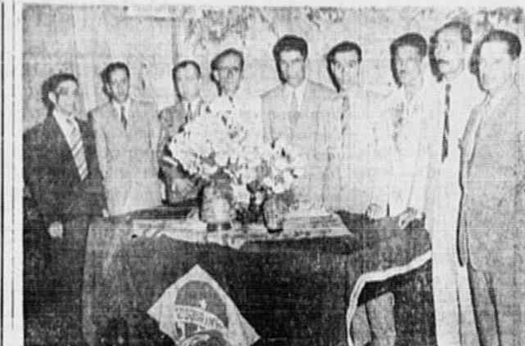
A SEDE DO SINDICATO DOS OPERARIOS NA INDUSTRIA DE TECELAGEM, de Niterói, realizou-se a solenidade de posse da nova diretoria. A sede social compareceram cerca de 500 operários, tendo os novos dirigentes recebido dos companheiros calorosa manifestação de apreço. O clichê acima apresenta os membros empossados

A greve é um direito sagrado do proletariado reconhecido em todas as democracias e pelo Brasil, ao assinado a ata de Chapultepec. É justa a greve decretada por uma corporação de trabalhadores quando todos os recursos conciliatórios já foram esgotados para a solução de uma reivindicação apresentada aos patrões. Mais do que nunca, a fase que vivemos em nosso país exige do proletariado uma unidade inquebrantável dentro dos seus princípios de classe. O Congresso Sindical do Distrito Federal, o Sindicato Nacional dos Sindicatos e, finalmente, a instauração da C. G. T. B. com a vitória da liberdade e da autonomia para os sindicatos, constituem a grande conquista da classe operária no Brasil.