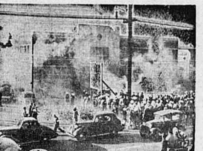
Aspecto de uma das recentes greves da América do Norte

Participam desse movimento grevista 750.000 siderúrgicos. Assim, o programa de reconversão atingiu sua crise culminante.