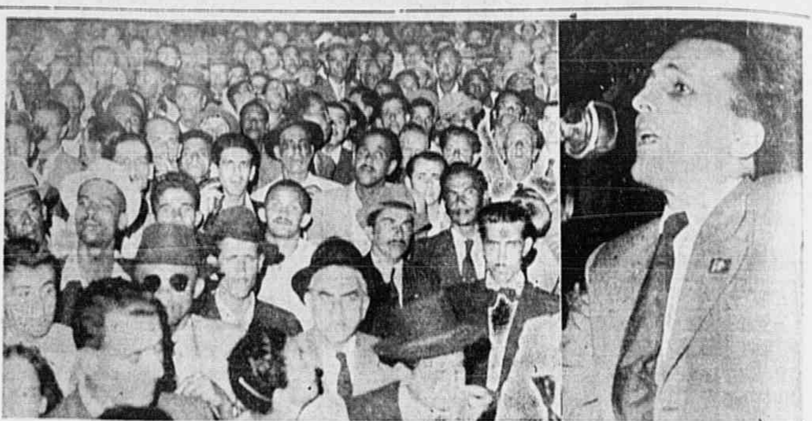
PRESTES FALOU NO LARGO DOS PILARES - Realizou-se domingo último, à noite, um comício no Largo dos Pilares, em Cachambi, promovido pelo Comitê Distrital do Meir, do PCB. Milhares de assistentes aplaudiram entusiasmadamente os oradores, que falaram sobre a necessidade da autonomia política e administrativa do Distrito Federal.

FRANÇA - O Partido Comunista francês revelou ontem pela manhã os seus pontos de vista sobre a situação criada em consequência da renúncia do General De Gaulle: "Governo apoiado sobre as esquerdas: comunistas, socialistas e radicais".