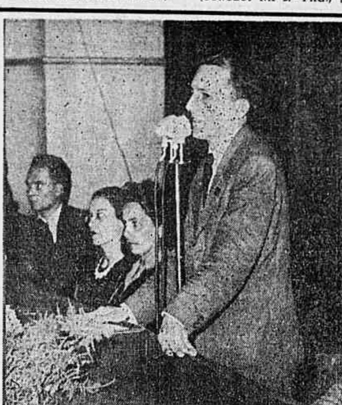
Prestes, quando falava, ontem, à noite, na Escola Nacional de Música, vindo-se ao seu lado as suas irmãs Eloisa e Ligia Prestes

Assim, o programa de reconversão atingiu sua crise culminante.