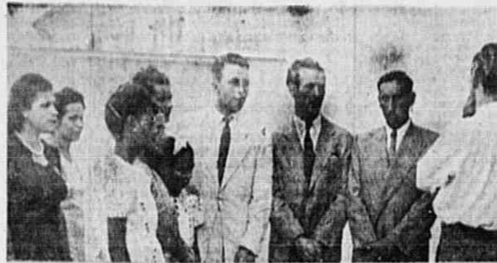
O COMITÊ DEMOCRÁTICO PROGRESSISTA DE LUCAS, na Leopoldina, entidade que muito se vem destacando...