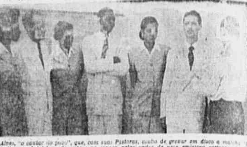
Ataulfo Alves, o cantor do povo, que, com suas Pastoras, acaba de gravar em disco e marcha "Sou Marmiteiro", a qual foi lançada entre as outras de uma emissora carioca, em visita à TRIBUNA POPULAR. Na chapa vemos Ataulfo Alves, suas Pastoras e os autores da música "Sou Marmiteiro", quando se apresentavam em um show...