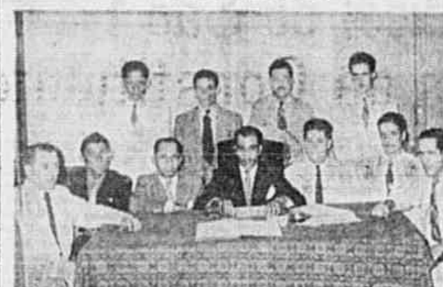
FOI EMPOSSADA, SOLENEMENTE, anti-ontem, em sua sede social, a rua Visconde do Rio Branco, em Niterói, a nova diretoria do Sindicato dos Operários Vitreiros de Niterói e São Gonçalo. No decorrer da solenidade, falaram vários operários, que enalteceram os companheiros eleitos, concitando-os a prosseguir a luta em defesa da classe. Na fotografia, os dirigentes no ato da posse

Entretanto — afirmou — sabemos agir com conciliação em todos os momentos em que esta conciliação for possível. Mas