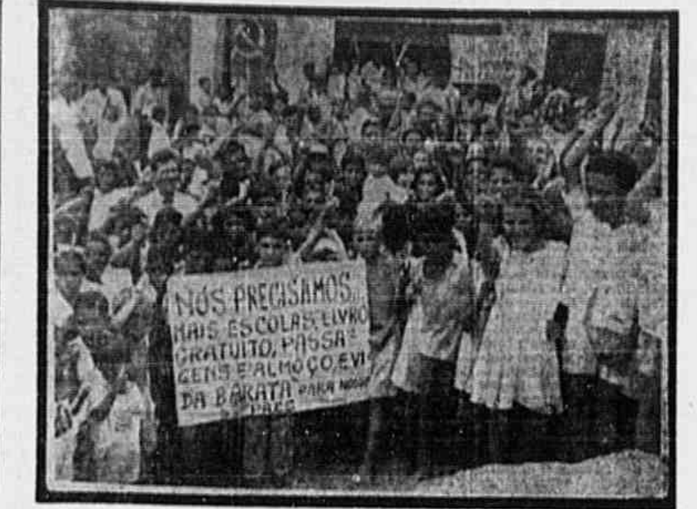
EN VILA MARI TI HAUGURA-SE, AMANHÃ, às 19 horas, a rua Teresopolis n.º 29, 30, 31 e do Comércio do Partido Comunista do Brasil, uma escola gratuita para crianças, que receberá o nome de "Alfabetização Popular", em homenagem à filha do literato nacional Luiz Carlos Prestes. O ato, que corresponderá a uma festa, terá caráter de solidariedade da população de Meriti, será aberto com uma solenidade pública, durante a qual serão cantados vários cânticos. Após a cerimônia será realizado um baile infantil em homenagem ao acontecimento e às crianças de Meriti.

NOTICIÁRIO CERAL COMITÊ DEMOCRÁTICO DO CENTRO DA CIDADE O Comitê Democrático do Centro da Cidade está convocando para uma reunião, hoje, às 20 horas, em sua sede social, a fim de tratar de assuntos de interesse geral. COMITÊ DE MULHERES DE REALENGO A direção do Comitê de Mulheres de Realengo Pró-Democracia está convocando todas as suas filiadas para comparecerem a uma reunião de magna importância, no próximo domingo, às 15 e 16 horas, à Rua Goulart de Andrade 26, em Realengo. Esta reunião será em conjunto com o Comitê Democrático Progressista de Realengo. OS ESPORTISTAS DO BARRIO DO PEDREGULHO O setor de esportes do Comitê Democrático e Progressista de Pedregulho, a fim de ampliar o seu quadro de praticantes de futebol, está convocando todos os esportistas do bairro para uma reunião em sua sede, hoje, às 19 horas, à Rua Ana Neri, 105. Também o Comitê está encabeçando o comparecimento, hoje, às 19 horas, em sua sede, de todos os seus associados.