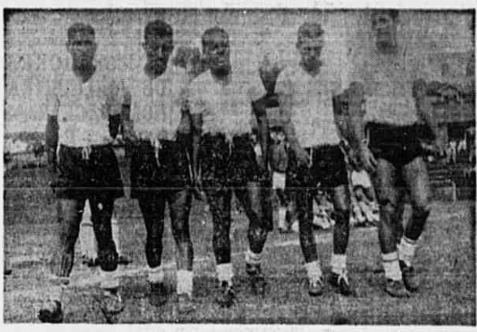
As seis o quinteto ofensivo brasileiro com Leonidas no comando. É quase certa a presença do "Diamante Negro", nos jogos do Sul Americano

MONTEVIDEU, 10 (De J. L. Pinto, para TRIBUNA POPULAR) -- Até agora não encontramos nenhuma notícia para aquele encerramento verdadeiramente inesperado da segunda partida pela "Copa Rio Branco". O prêmio tinha sendo disputado com entusiasmo pelas duas equipes. Dentro do gramado os jogadores tinham agido com entusiasmo. A despeito dos esforços tremendos desenvolvidos pela equipe de casa, a disciplina tinha sido perfeita. Falaram apenas onze minutos para o fim da batalha. O "placard" apresentava a seguinte situação: 0-0. O árbitro Armenthal não permitiu que nenhum dos jogadores se aproximasse do gol. Foi então que se deu o início da partida. O jogo foi muito interessante. O jogo foi muito interessante. O jogo foi muito interessante.