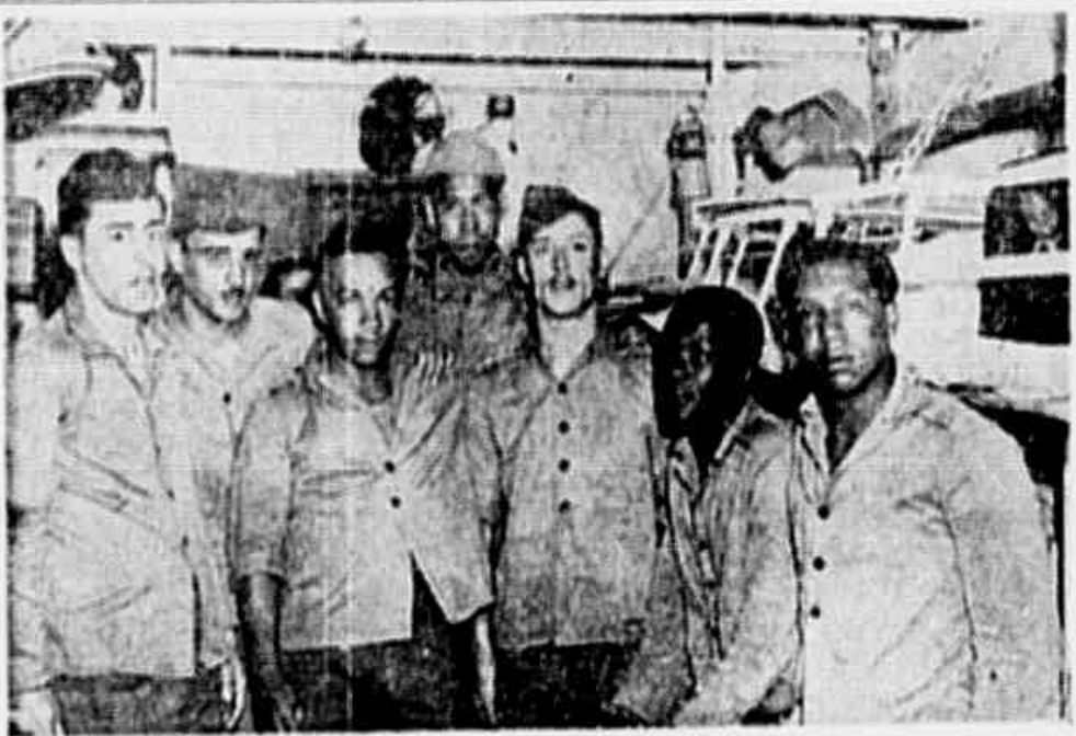
Expedicionários feridos que untem regressaram ao Brasil

ANO I N.º 183 Av. Afonso Borges, 207-11.ª SABADO, 22-12-1945