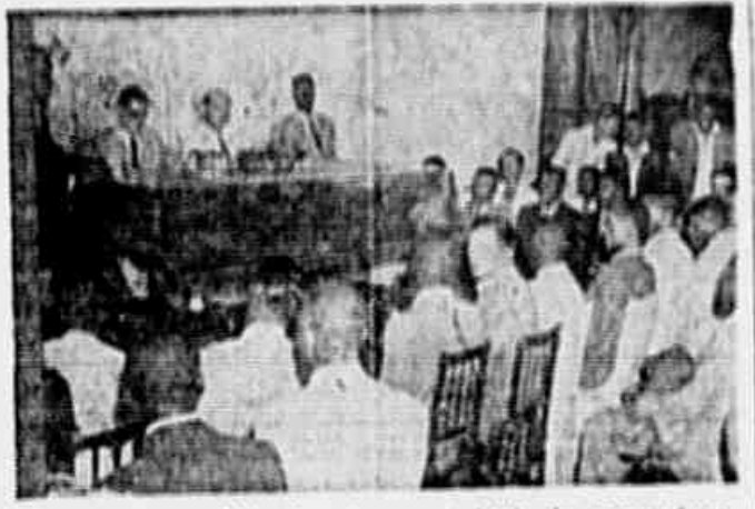
Durante a reunião de ontem no sindicato dos carregadores e encasadores