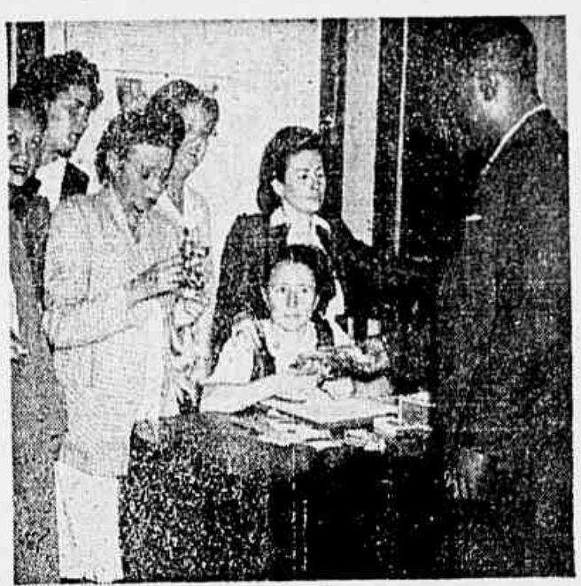
O recebimento de donativos para o Natal do expedicionário

Milhares de presentes serão oferecidos, hoje, aos mutilados de guerra ★ Levem os seus presentes, ainda hoje, à "Associação do Ex-Combatente"