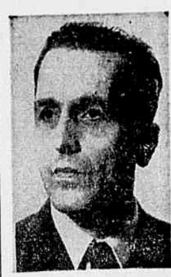
Luiz Carlos Prestes

Luiz Carlos Prestes enviou ontem, em nome do Partido Comunista do Brasil, telegrama de felicitações ao generalíssimo Stalin, por motivo do transcurso do 66.º aniversário natalício do genial estadista, guia dos povos soviéticos. E' do seguinte teor a mensagem assinada pelo secretário geral do Partido Comunista do Brasil: "Generalíssimo Stalin — Kremlin, Moscou — Por motivo da passagem do aniversário natalício do grande chefe e guia dos povos soviéticos apresentamos-lhe as nossas felicitações em nome do Partido Comunista do Brasil. A data de hoje, que é de regozijo para os povos do mundo inteiro que conseguiram a derrota da besta fera nazista grata-