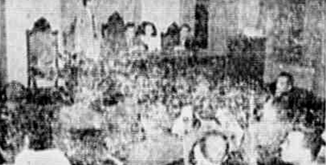
Aspecto da sessão que presidiu o encontro dos ferroviários da...