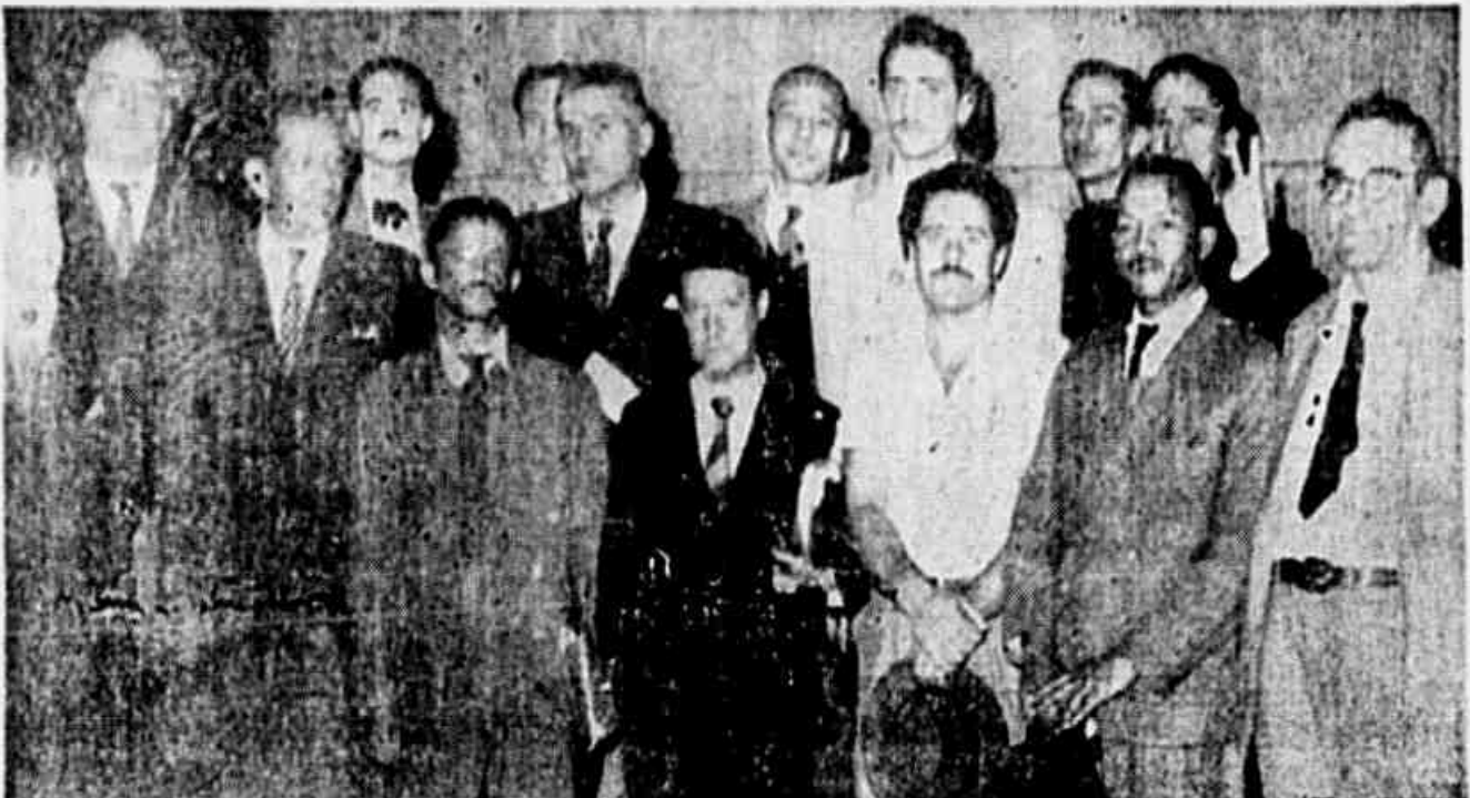
ESTEVE REUNIDA, ONTEM, NA A.B.I., a Comissão Central dos Trabalhadores Pró-Candidatura Yeddo Fiúza, a fim de discutir a propaganda, nas horas proletárias, da candidatura do engenheiro Yeddo Fiúza, candidato de União Nacional à presidência da República. Na reunião ficou deliberado instalar-se uma Comissão Permanente, que passará a funcionar, a partir de hoje, na sede da Comissão Central Pró-Candidatura Yeddo Fiúza, à rua Alcazar Alvim n.º 37, 5.º andar, sala 90, que atenderá a todos os eleitores, facilitando informações relativas ao pleito. A Comissão distribuirá, hoje, em todos os locais de trabalho, um Manifesto exortando o proletariado nacional a cerrar fileiras em torno do nome do candidato de União Nacional, Yeddo Fiúza

ANO I * N.º 163 * Av. Aparício Borges, 207-13. * RIO * TERÇA-FEIRA, 27-11-1945 * Capital, 0,40; Estados, 0,50