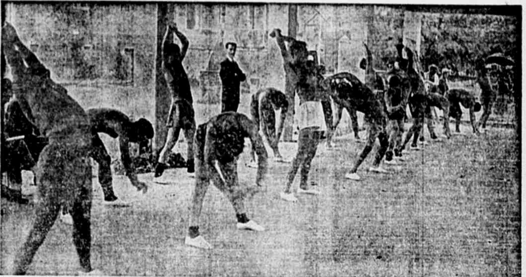
Os scratchmen brasileiros, no ensaio individual de domingo.

Como falou Flávio Costa, aos jogadores, antes do ensaio