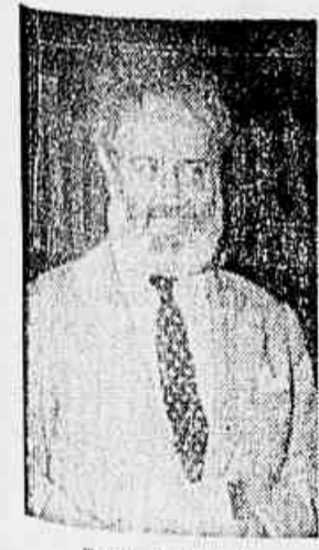
Barão de Itararé

O espetáculo cívico-artístico que se realiza hoje, ás 10 horas, na Praça Senz. Pena, com a colaboração de alguns dos mais destacados artistas do rádio brasileiro, é bem uma amostra do sucesso do desenvolvimento da campanha eleitoral do Partido Comunista do Brasil.