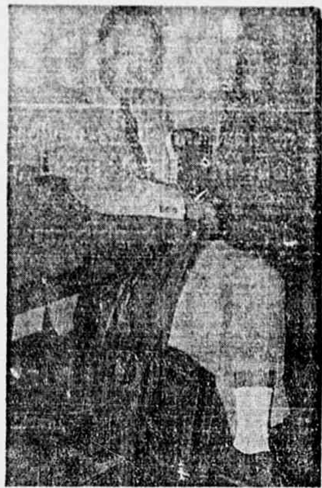
Odair, à espera do julgamento

O treinador do Bonsucesso está suspenso de suas atividades esportivas por 12 meses, de acordo com o artigo 44 do Código Disciplinar de Penalidades, que pune o suborno o atentado de suborno.