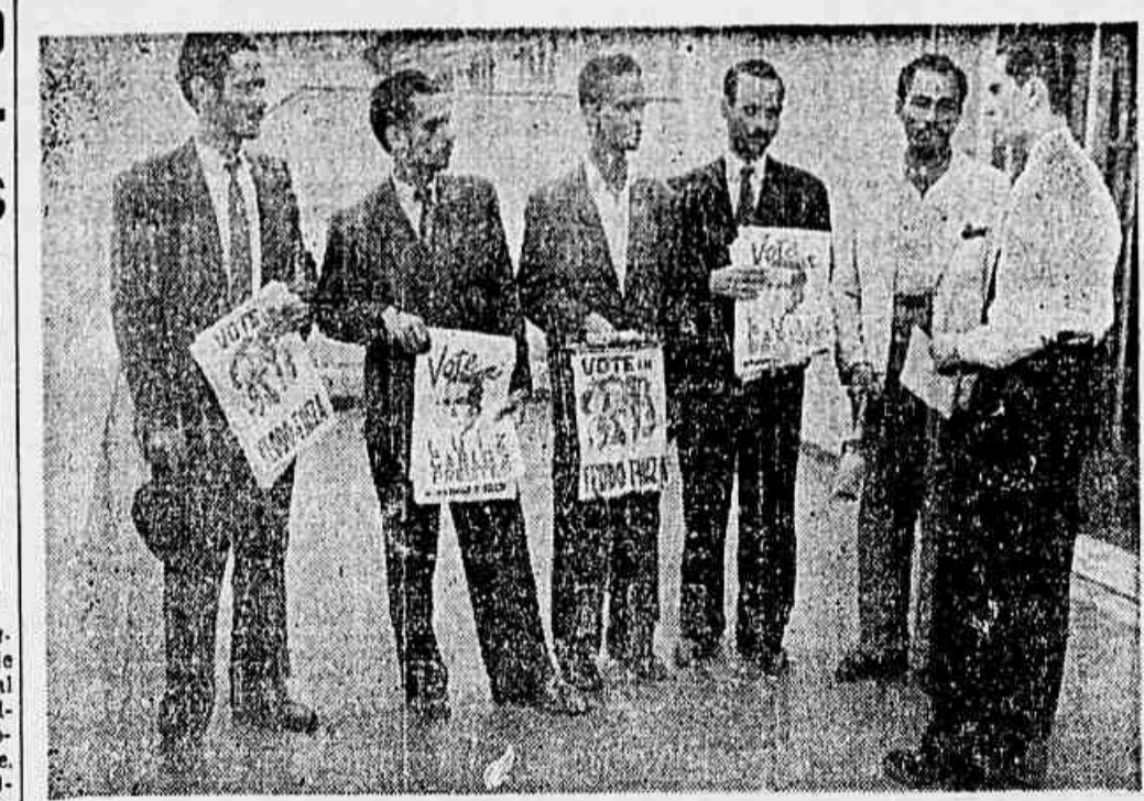
Alguns dos adeptos da candidatura do povo detidos na noite de ante-ontem. Em visita à TRIBUNA POPULAR, imediatamente após terem saído da prisão