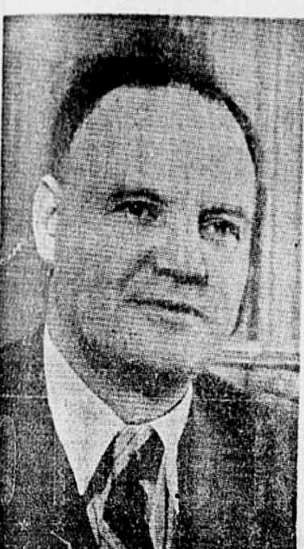
Maurice Thorez, secretário geral do Partido Comunista Francês, numa recente fotografia