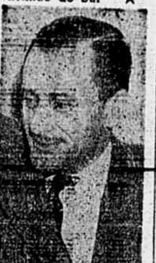
Dr. Alberto Pasqualini

Comícios de propaganda em todo o Rio Grande do Sul