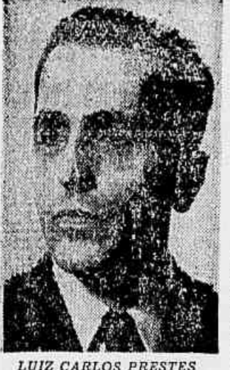
LUIZ CARLOS PRESTES

Cabe ao povo reforçar sua organização e exigir do governo a modificação do Ato Adicional