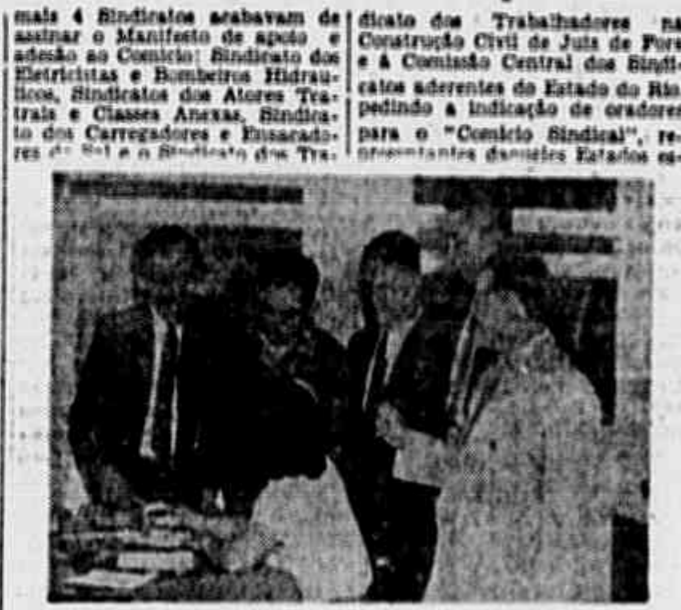
Na reunião da "Tribuna Popular", quando tiveram os trabalhadores da Construção Civil, que vieram prestar declarações acerca do grande comício sindical Pró-Constituinte