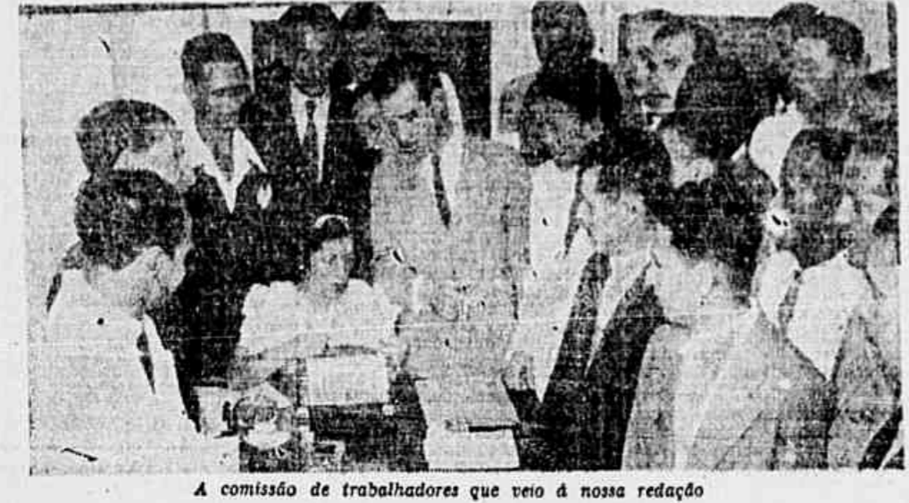
A comissão de trabalhadores que veio à nossa redação