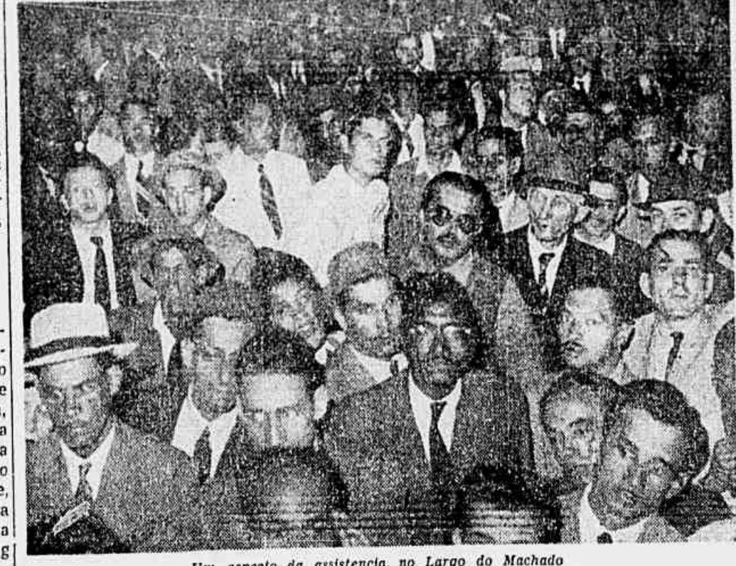
Um aspecto da assistência, no Largo do Machado