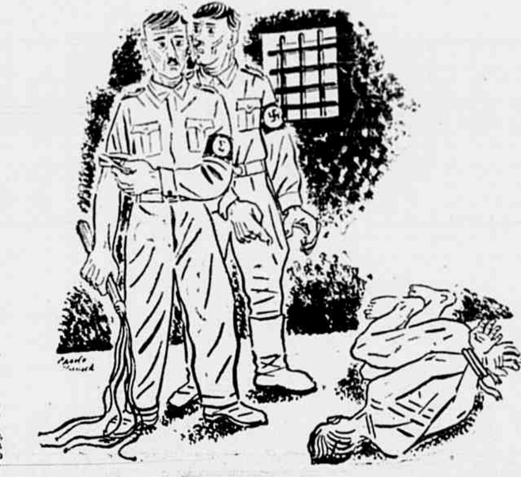
(CONCLUE NA 2ª PAG.)