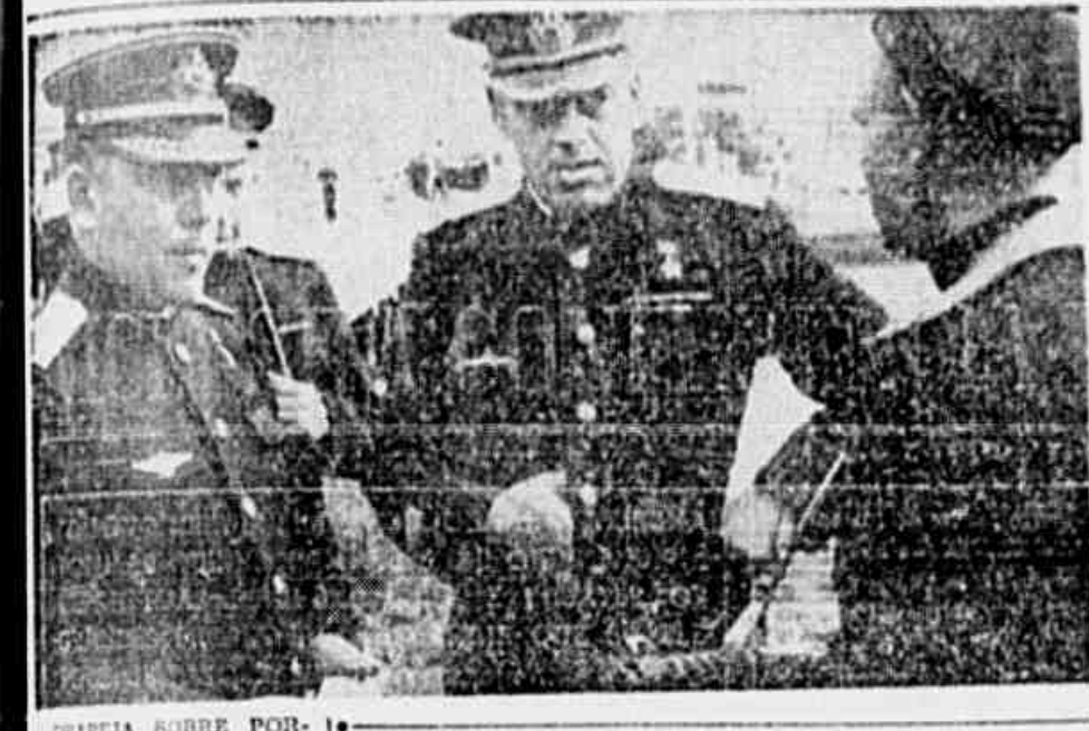
DRAPAJA SOBRE PORTO ARTHUR a Família da Unidade de Guerra Soviética...

A Corte de Justiça Argentina e o governo Peron