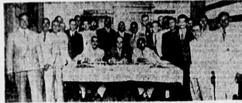
ASSOCIAÇÃO PROFISSIONAL DOS MESTRES E CONTRA-MESTRES DE FIAÇÃO E TECELAGEM DE S. JOSÉ DE ALEM-PAIBA. A recente fundação, na vizinha cidade mineira da Associação Profissional dos Mestres e Contra-Mestres de Fiação e Tecelagem...