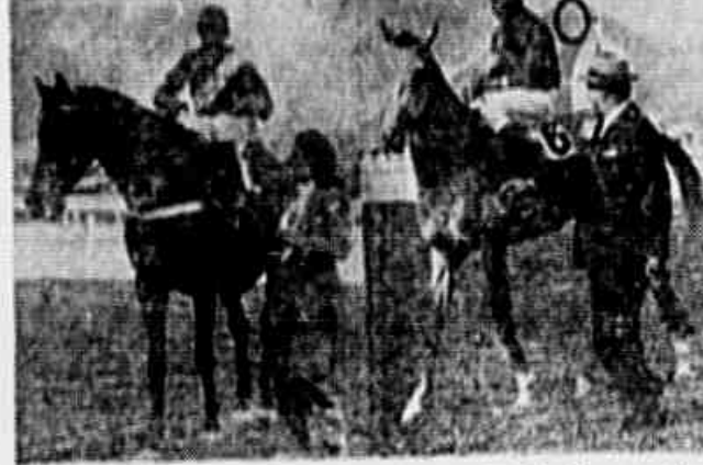
Typhoon e Vontade, os vencedores das Grandes Premias Distrito Federal e Duque de Caxias, quando regressaram à Pórtuguesa segurando pelos seus proprietários.