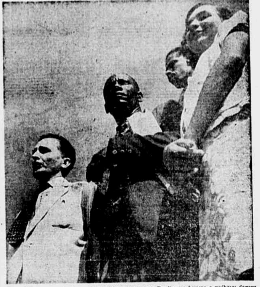
Os mortos de S. Carlos e do Querorene, Prestes ouviu as reivindicações de seus moradores. No Realengo falou em contacto directo com a população sobre os mais sentidos problemas, respondendo a uma serie de perguntas que lhe fizeram homens e mulheres do povo