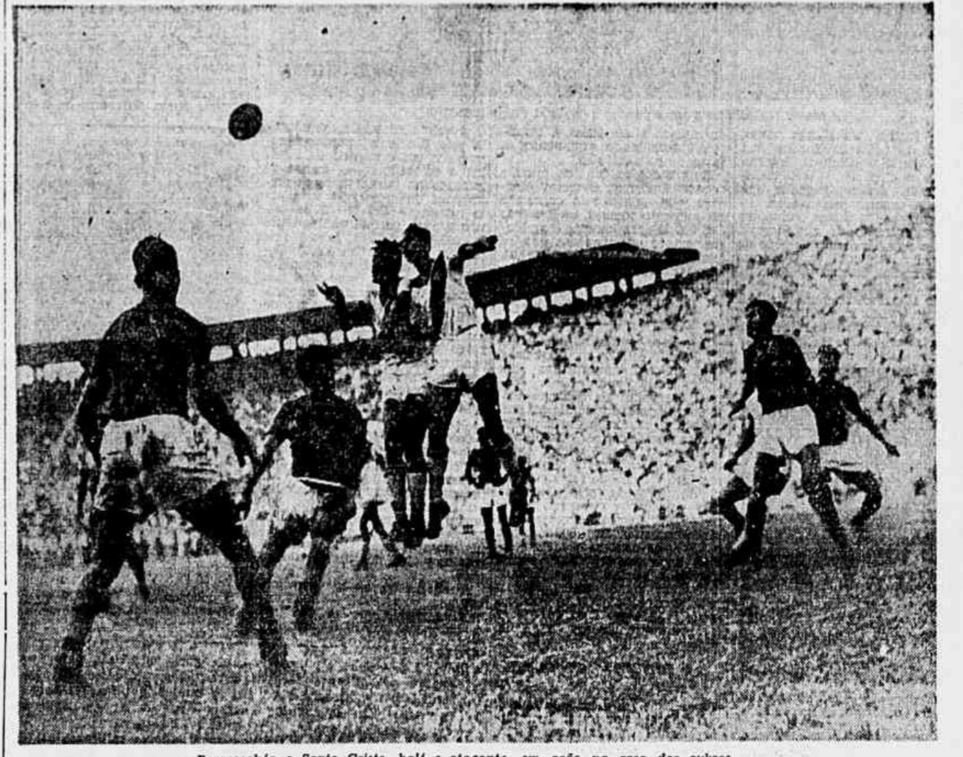
Berascochéa e Santo Cristo, half e atacante, em ação na area dos rubros

Vasco e America fizeram o match principal da oitava rodada. O jogo, ao contrario do prelo de