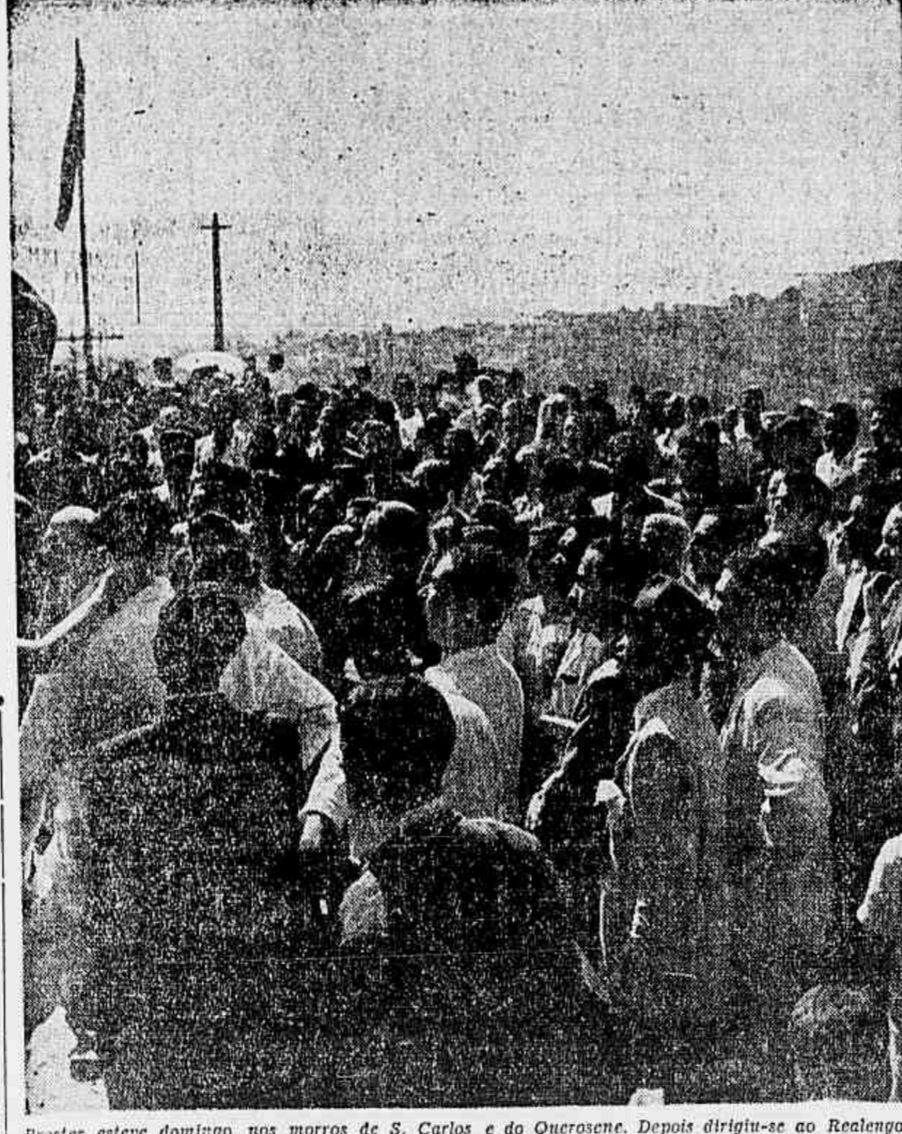
Prestes esteve domingo, nos morros de S. Carlos e do Querorene. Depois dirigiu-se ao Realengo e a Santa Cruz. Falou directamente aos homens do povo. No clichê acima aparece moradores do morro S. Carlos quando ouviam um discurso do secretario do Partido Comunista