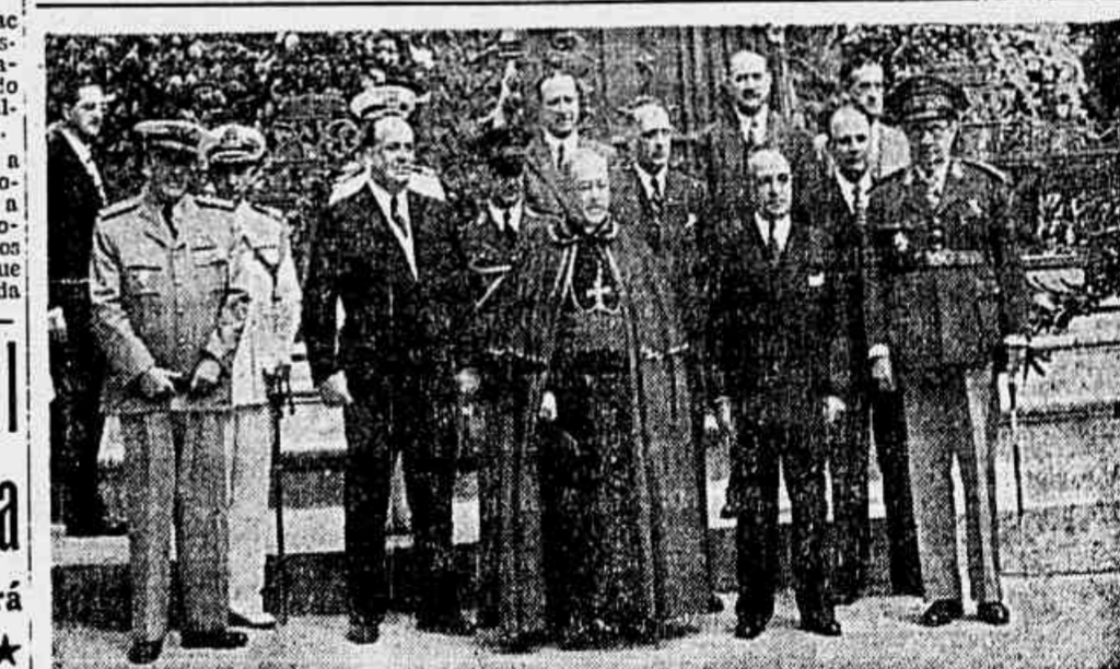
Altas autoridades ao pé da estatua de Caxias