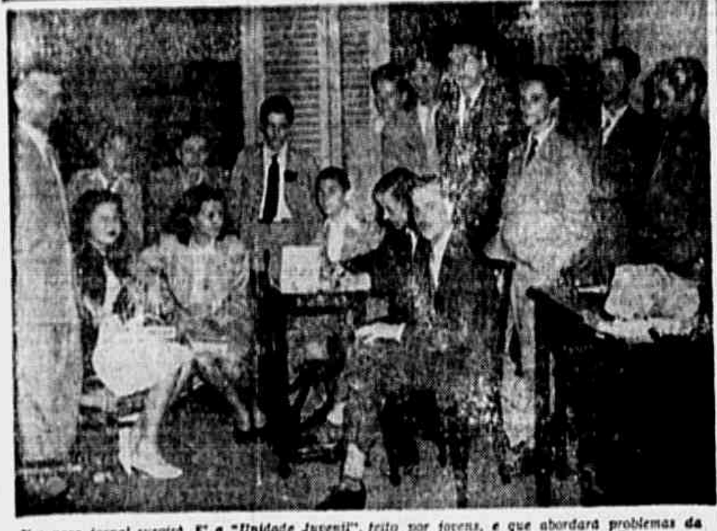
Um novo jornal surgirá. É a "Unidade Juvenil", feito por jovens, e que abordará problemas da mocidade, contribuindo para o desenvolvimento da democracia no Brasil.