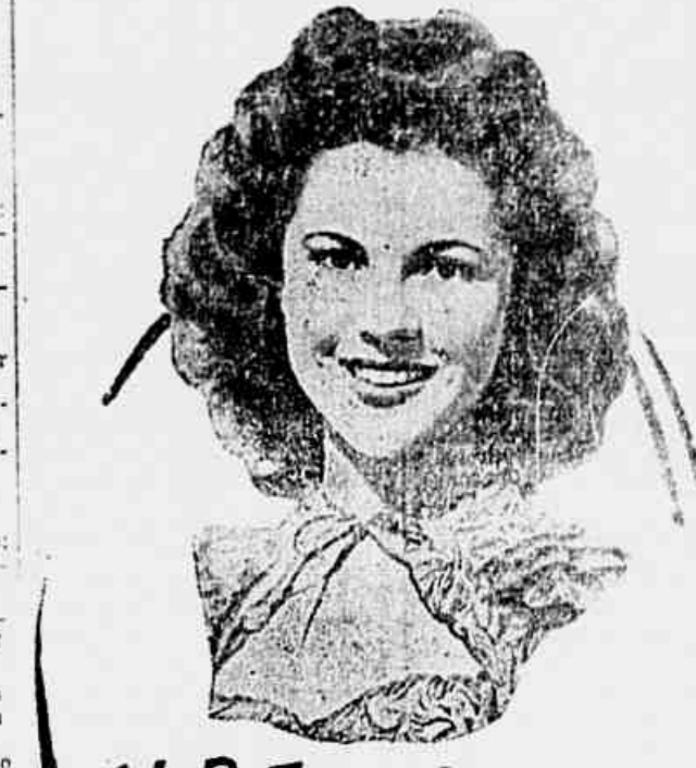
VER-TE-UI OUTRA VEZ

Shirley E também Ginger Rogers e Joseph Cotten