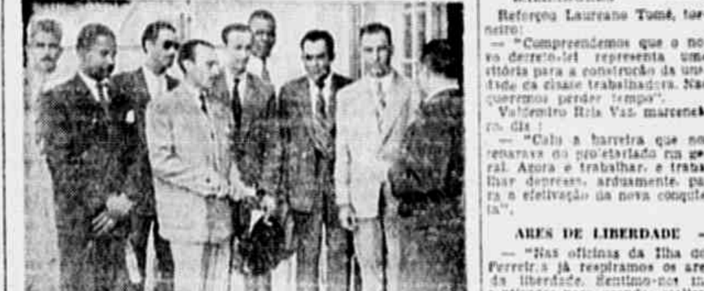
"Esperamos agora que o Governo estenda a medida a todos os trabalhadores autárquicos e para-estatais".

Falam à TRIBUNA POPULAR membros do Comitê Democrático dos Trabalhadores da Ilha dos Ferreiros