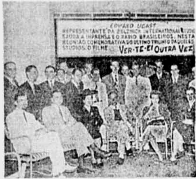
Representante da Selnick International Studio...