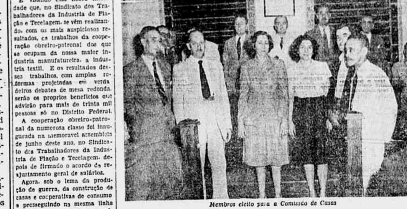
Membros eleito para a Comissão de Casas

UMA ASSEMBLEIA DE MAIS DE DOIS MIL OPERARIOS Figuravam na ordem do dia da reunião numerosos estudos sobre o programa de organização de uma cooperativa de consumo e de construção de casas de moradia, bem como da edificação de nova sede sindical. Incluiu-se, também, na pauta dos trabalhos, a questão da produção de guerra. Numa significativa demonstração de interesse pelos assuntos que falam diretamente à classe e pelos problemas que se ligam intimamente à economia do país, os operários textéis compareceram à reunião em numero bastante elevado, podendo calcular-se em mais de 2 mil associados. Toda essa massa compacta acompanhou vivamente os debates, neles intervindo oradores e apurados, movidos todos pelo desejo de esclarecer a matéria