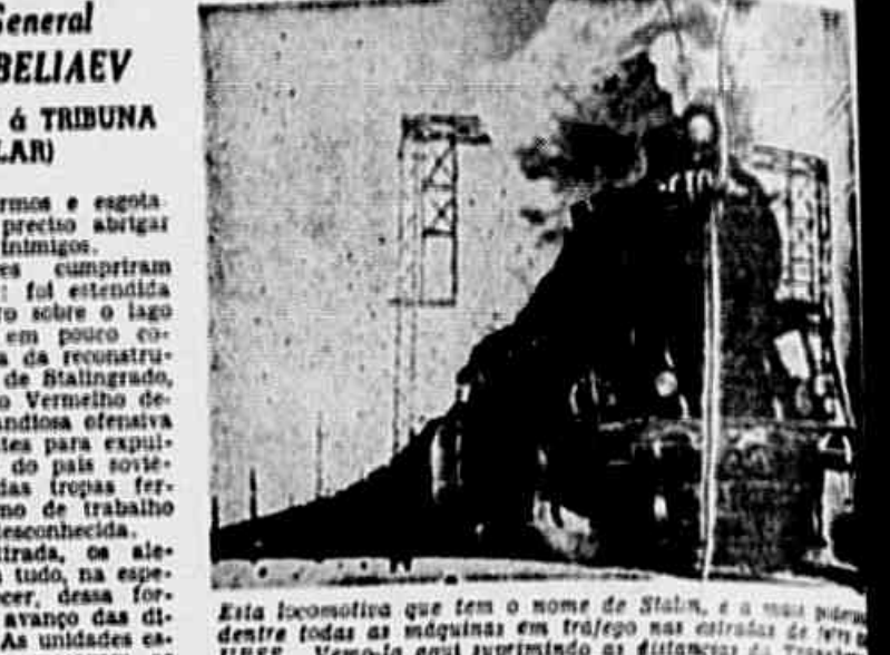
Esta locomotiva que tem o nome de Stalin, e a mais poderosa dentre todas as máquinas em trajetos nas estradas de ferro da URSS, vem-lhe aqui suplantando os obstáculos da reconstrução, numa fotografia especial para "Tribuna Popular".

De Moscou (Via Frewi) — Desde a primeira etapa da guerra, a rede de estradas de ferro, as tropas ferroviárias lutaram pelas estações, paradas e entroncamentos. Os alemães tentavam ocupar. Outro trabalho dos ferroviários foi o de impedir que os fascistas pudessem utilizar as vias que cassem em suas mãos.