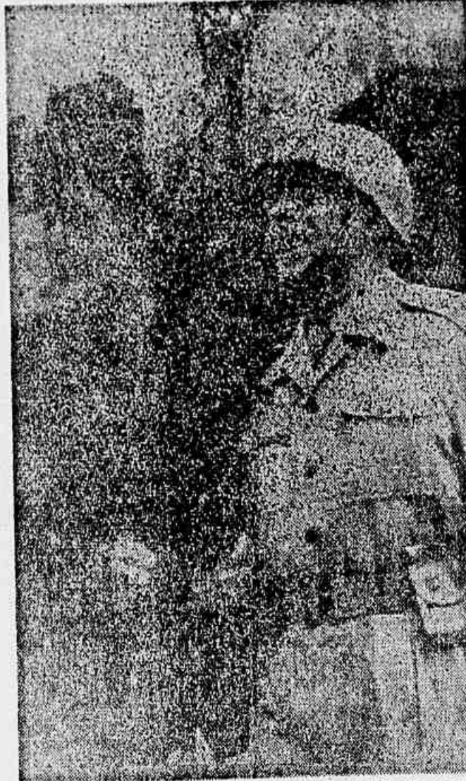
O general Cordeiro de Farias, comandante do 2º Escalão da FEB, em companhia de sua esposa, momentos depois do desembarque em Copacabana.