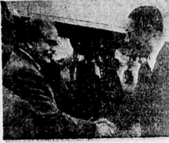
Ao chegar em Moscou, o "premiê" chinês T. Y. Dong e acompanhado pelo Comandante do Exército da URSS, Vissarion Molotov...