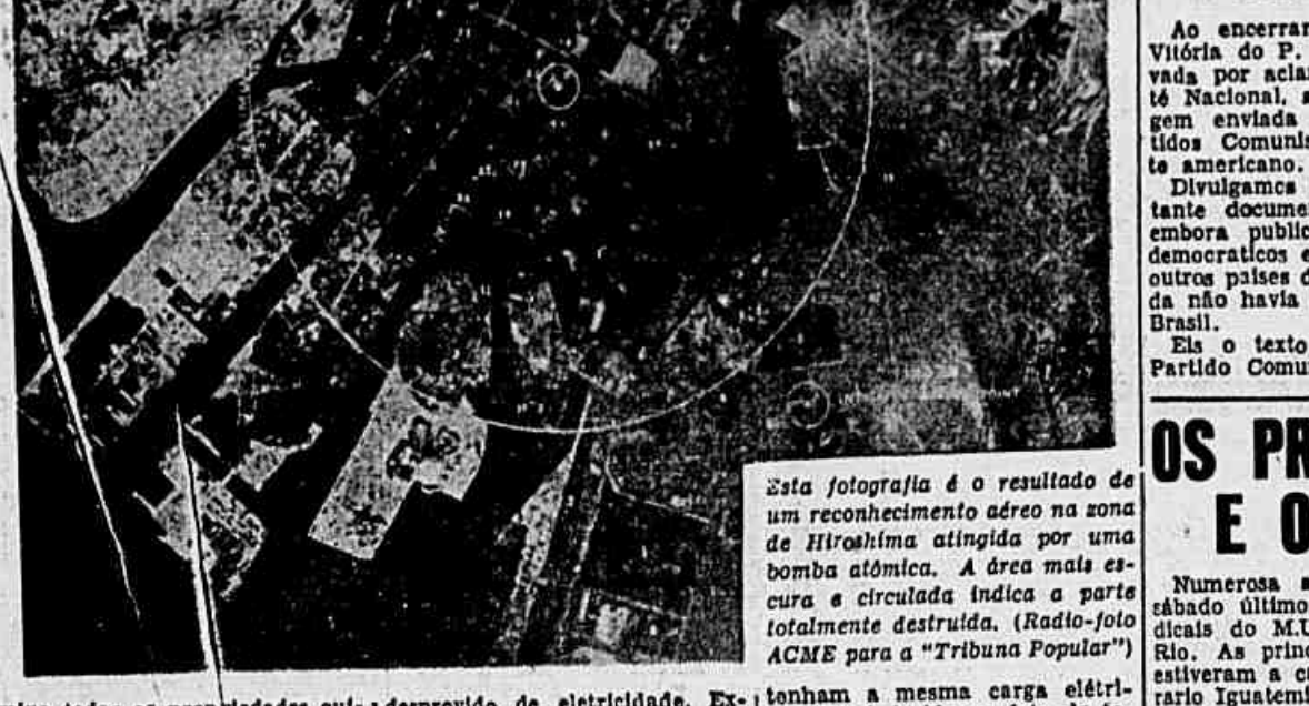
Esta fotografia é o resultado de um reconhecimento aéreo na zona de Hiroshima atingida por uma bomba atômica. A área mais escura e circular indica a parte totalmente destruída.

O casal Curie, Fermi, Lisa, Meitner, Strassman e outros pesquisadores estudam a desintegração do átomo — Por pouco a perigosa arma cairia em mãos dos nazi-fascistas