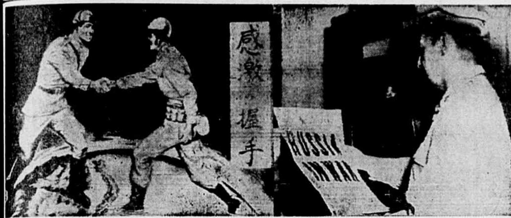
As fotos acima reproduzem aspectos da guerra que acaba de terminar no Extremo Oriente. No clichê à esquerda, aparece, sem casaca, um soldado americano num aperto de mão fraternal com um soldado do Exército Vermelho. A direita o Gen. Mac Arthur no momento em que recebe a notícia da entrada da União Soviética na luta de extermínio da militarização nipônica. (Foto ACME, especial para a "Tribuna Popular").