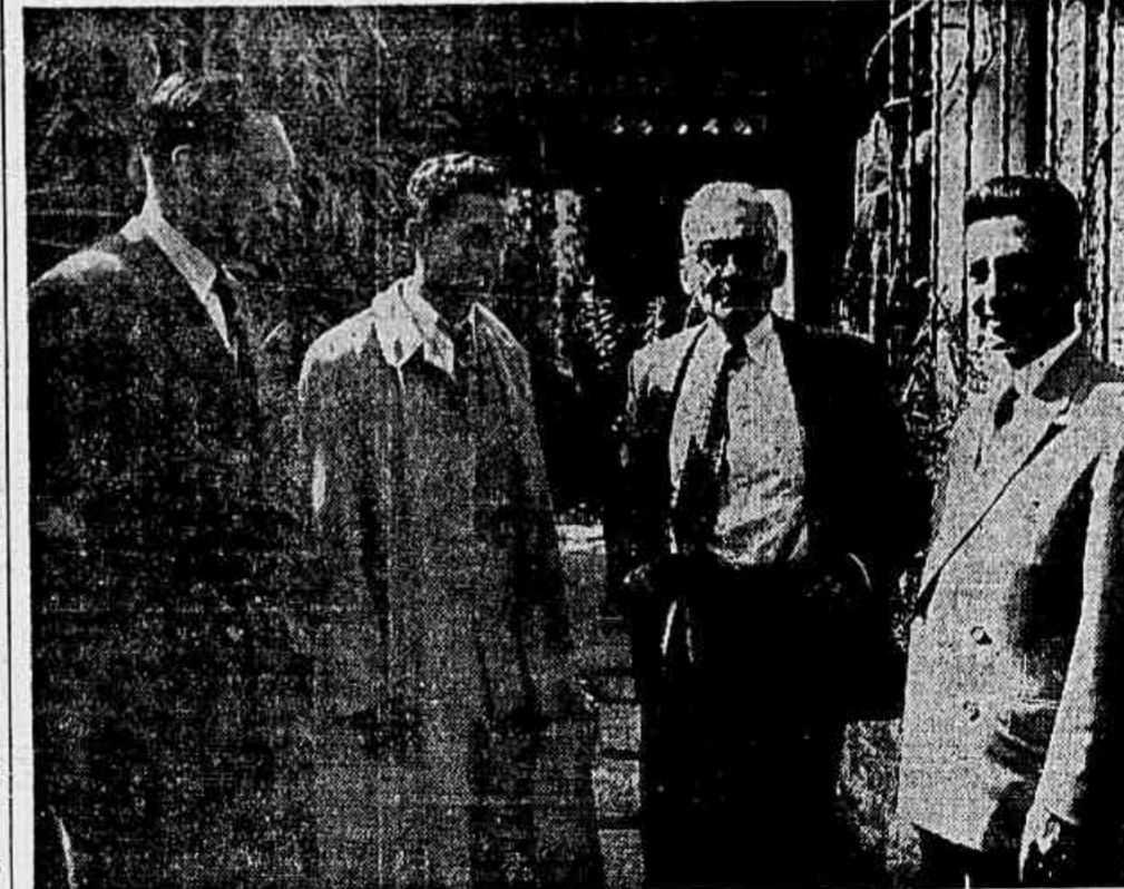
Nossa reportagem surpreendeu Monteiro Lobato em sua residência, ao lado do líder comunista José Crispim, o maior amigo do grande escritor na classe operária

Organizar uma campanha sistemática em prol da restauração do regime democrático em sua patria. Entre outras medidas delibrou-se apelar para os governos dos Estados Unidos, da Inglaterra e da União Soviética, solicitando a aplicação, em Portugal, das medidas assentadas em Potsdam pelas democracias vitoriosas. (CONCLUE NA 2.ª PAG.)