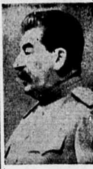
Churchill exalta Stalin e os Exércitos Soviéticos

BUENOS AIRES, 16 (A. P.). — As forças militares ocuparam o palacio do governo, em meio aos crescentes indícios de novos choques esta noite entre os grupos nacionalistas e democráticos. Num movimento considerado significativo, as autoridades ordenaram esta tarde que a Casa Rosada fosse fechada a todos os civis, inclusive jornalistas. Os conscritos da 1.ª Divisão de Infantaria receberam ordens de montar guarda aos edifícios publicos, distribuídos em posições estratégicas. Esses guardas conduziam o "equipamento correspondente" para qualquer emergência. Simultaneamente, a policia federal divulgou um comunicado resumindo os acontecimentos dos últimos dias, acusando as demonstrações como de "tendência estritamente comunista". Afirma o comunicado que as manifestações foram inspiradas por elementos de inclinações comunistas muito conhecidas. Com referencia aos conscritos, que ontem à noite reforçaram os nacionalistas nos conflitos com os grupos democráticos. (CONCLUE NA 2.ª PAG.)