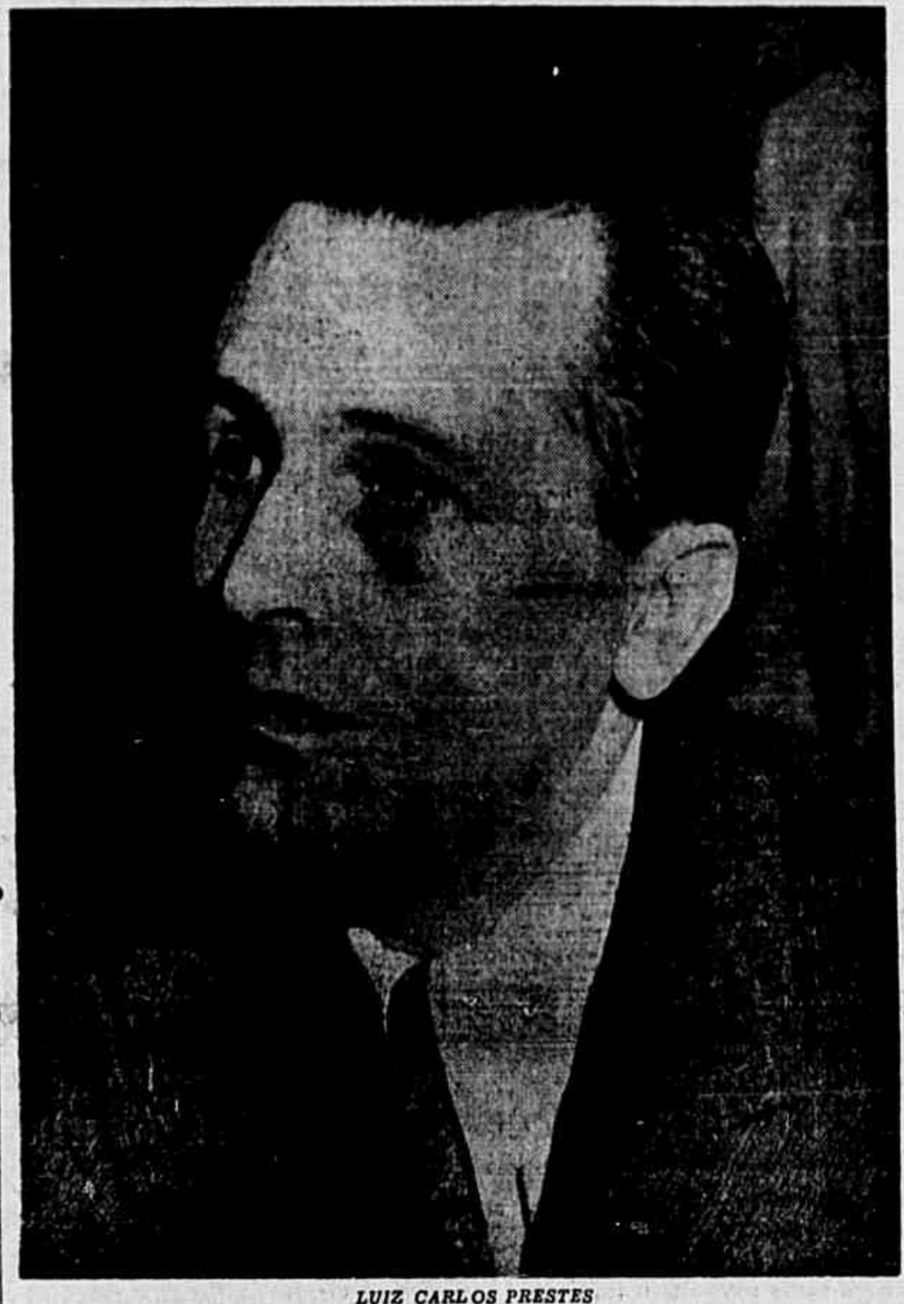
LUIZ CARLOS PRESTES

Na sessão pública realizada ontem pelo Partido Comunista, no Clube de Engenharia, encerrando a solenidade em que o Partido, pela primeira vez apresentava legalmente os resultados de seus trabalhos durante uma reunião plenária do Comité Nacional, o dirigente máximo do P. C. B. Luiz Carlos Prestes pronunciou importante discurso, no qual analisou, em síntese, os últimos acontecimentos mundiais e nacionais, tirando conclusões para orientação e esclarecimento do povo nos dias que vivemos e para um futuro próximo.