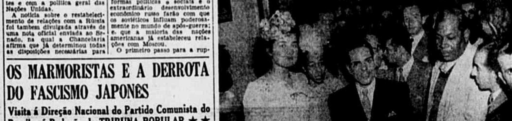
Flagrante expressivo de noivos, noivos e convidados, ainda na doce perspectiva da realização do casamento. Depois foi a desilusão, com a fuga precipitada do juiz.

O juiz, por causa do feriado, não quis fazer os casamentos — Muita confusão e nada feito — Intervem a policia, colocando-se ao lado do magistrado e contra os noivos