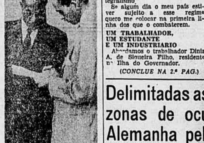
Muitos quiseram escrever suas declarações de repulsa ao integralismo

neiro foi indicada para sede da Conferência, que se realizará com aquele fim, e, no mesmo tempo, ficou convidada ao Governo do Brasil a honrar a incumbência de convidar o Governo das Repúblicas Irmãs a enviarem representantes a tão importante reunião. Para dispenha de desagravo, o Senhor Presidente da República acaba de me dar instruções no sentido de transmitir o aludido convite a esse governo, com a sugestão de que a nova conferência se inaugure a 20 de Outubro próximo sob a denominação de Conferência Interamericana para a Manutenção da Paz e da Segurança do Continente.