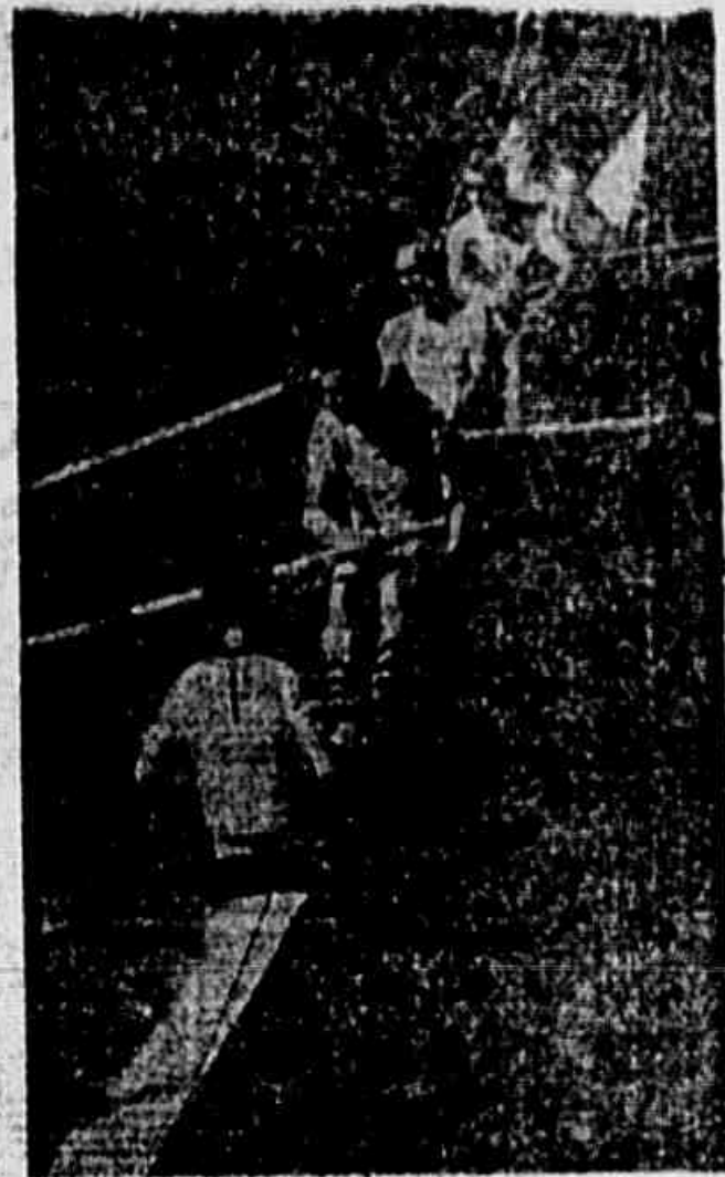
O quatro com patrão da Argentina, vencedor da quinta prova

Vitoriosos em tres pareos -- Os brasileiros no segundo posto -- O que foi o importante Certame Continental