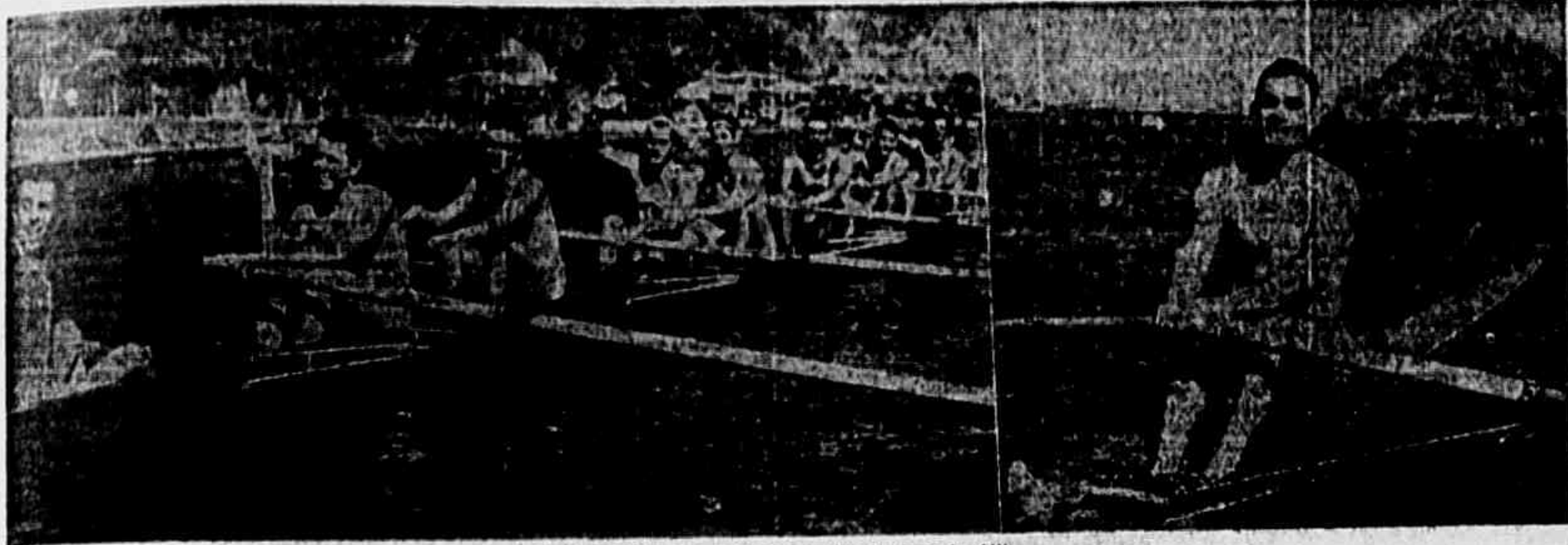
O oito brasileiro e o vencedor argentino da prova de oito