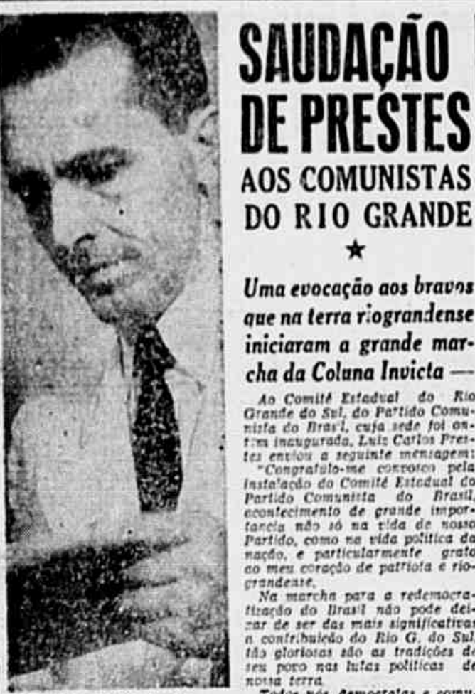
Luiz Carlos Prestes

O ARMISTICIO FOI UMA TRAIÇÃO DOS CHEFES MILITARES À CONFIANÇA DE CHURCHILL E ROOSEVELT — O "QUISLING" DE VICHY, RETARDOU AO MÁXIMO A PARTIDA DO GOVERNO PARA ULTRAMAR