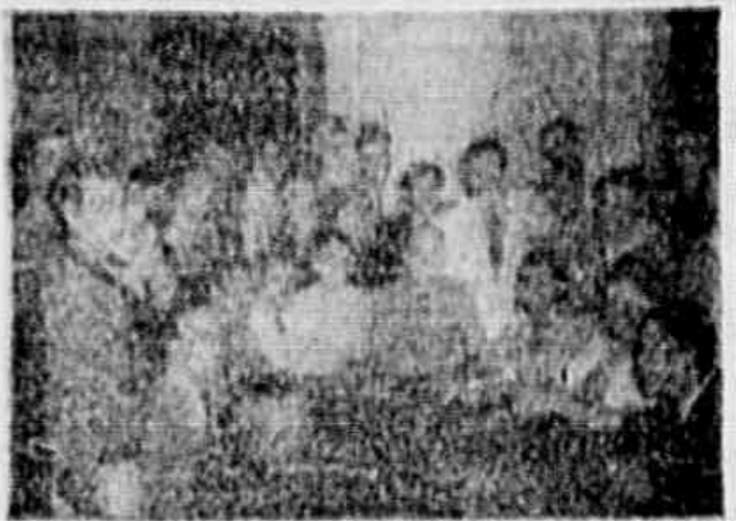
COMITÊ DEMOCRÁTICO PROGRESSISTA DE HIGIENIZAÇÃO - Reunião de Higiênização realizada em rua José Estrela, nº 71, por ocasião da fundação do Comitê que propugna pela higienização da cidade.

Foram aprovados os relatórios do Departamento de Assistência Social e do Departamento de Assistência Médica.