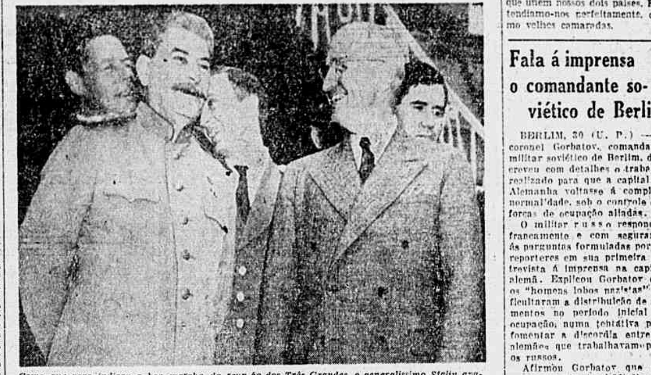
Como que para indicar a boa marcha da reunião dos Três Grandes, o generalíssimo Stalin aparece sorridente com o seu bom humor característico, ao lado do Presidente Truman.

POTSDAM, 30 — Por do se achava ela no auge de suas deliberações, é uma prova evidente de que os Três Grandes estão firmemente decididos a resolver todas as questões mais melindrosas que possam vir a perturbar a paz futura.