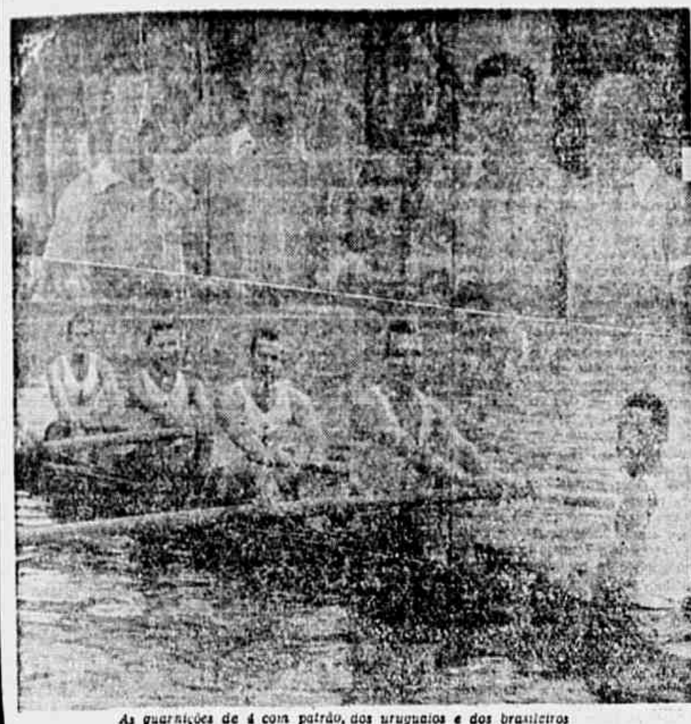
As guarnições de 4 com patrão, dos uruguaios e dos brasileiros