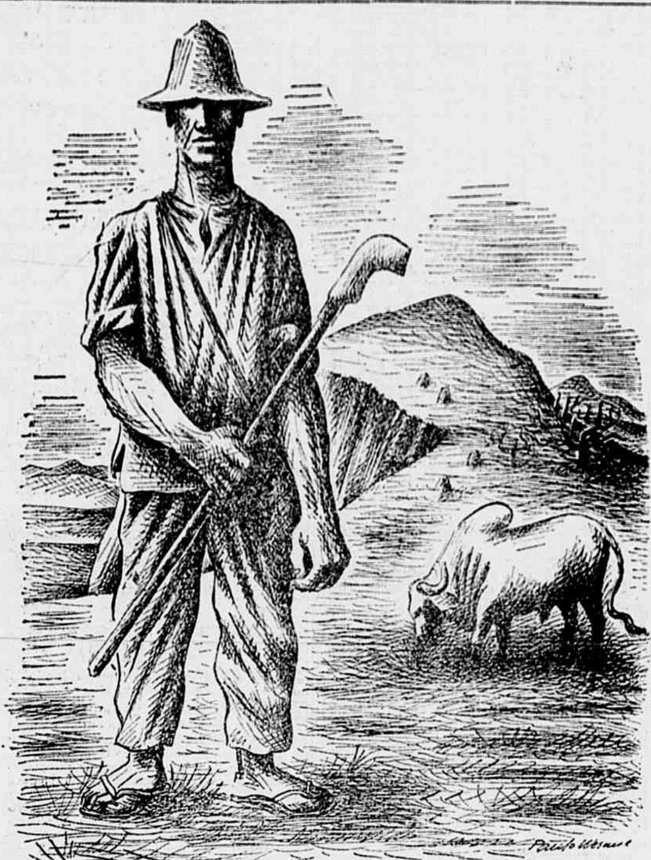
DESENHO DE PAULO WERNECK

Quando Picasso chegou a Moscou, em 1945, encontrou a obra de Picasso que havia sido feita em 1937, durante a Exposição Internacional de Paris.