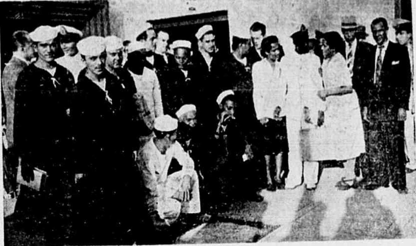
O fotógrafo da "Tribuna Popular" apanhou no aeroporto Santos Dumont, o flagrante acima quando ali chegaram os 16 naufragos do "Bahia". Vê-se ao lado dos mesmos, pessoas das suas famílias e amigos.

POTSDAM, 28 (De Ernest Vaccaro, da A. P.) — Os "big three" reiniciaram sua conferência, logo após a chegada do sr. Clement Attlee, novo premier britânico, que veio substituir Churchill nas importantes deliberações de que depende o futuro do mundo. Os três grandes se reuniram imediatamente depois que o sr. Attlee fez visitas formais ao presidente Truman e ao generalíssimo Stalin. Salientou-se que a sessão plenária começou sem a menor demora. Com a ausência de Churchill pela primeira vez, a Conferência recomeçou no ponto onde o ex-premier britânico a havia deixado, afim de ser informado do que o eleitorado inglês o rejeitara de maneira esmagadora.