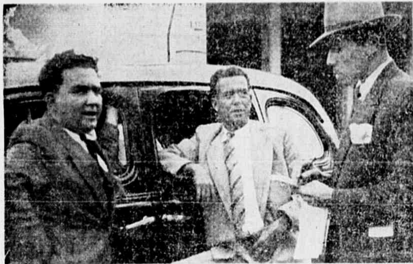
Satisfeitos com a eletrificação, os donos de carros de praça palestram com o "reporter".

Sobre as vantagens da eletrificação da Central do Brasil, em Bangú e Campo Grande