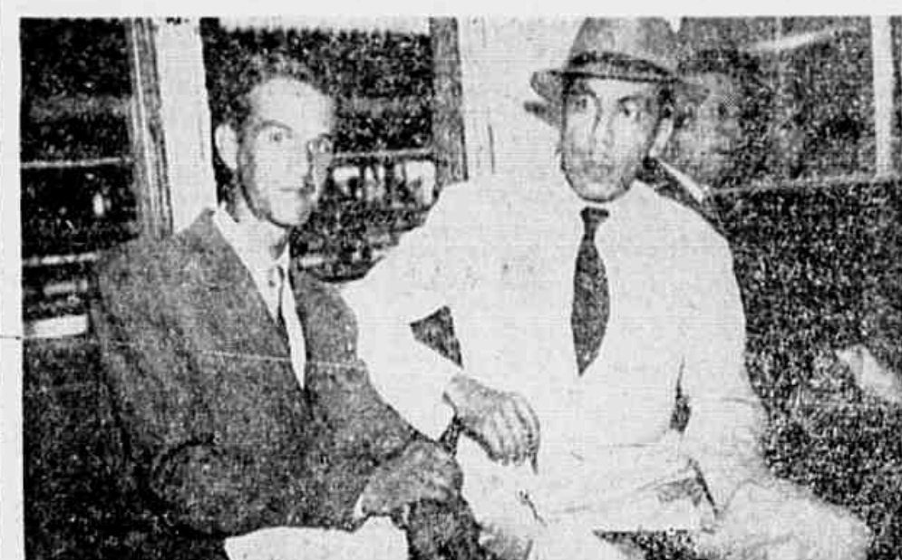
Num elétrico, um funcionário público, fala sobre as vantagens da eletrificação.

cal que conta com mais de cinco mil operários vindos de diversas zonas. Como todos sabem, antigamente eram frequentes os atrasos dos trens neste ramal; hoje porém já não se dá o mesmo. A rapidez com que se faz o transporte de passageiros não mais permite que os trabalhadores que se servem dos trens da Central percam a hora exata da chegada para o "ponto". Penso — acrescenta o sr. Os-