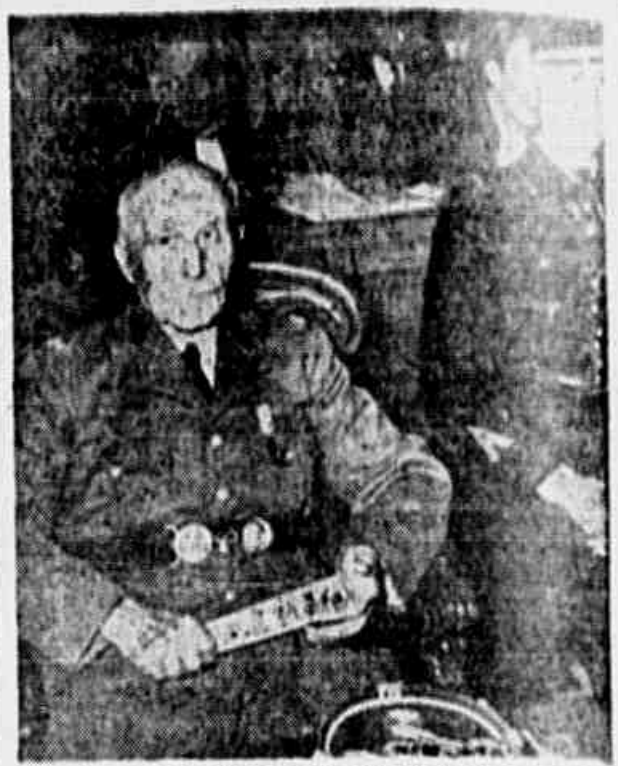
Esta é a primeira fotografia do julgamento de Pétain, que responde sua pátria no tribunal francês. O velho soldado comunista aparece no Tribunal, em Paris, ostentando a faixa de marechal de França, a qual desonrou como ninguém