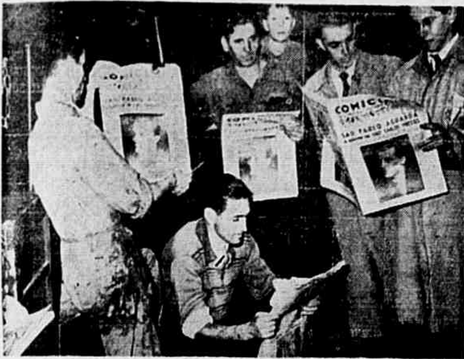
Nas horas de folga os trabalhadores lêem o jornalzinho "O Comício"

TODAS AS CLASSES SOCIAIS VIVAMENTE INTERESSADAS NO GIGANTESCO "MEETING" — CARAVANAS DO RIO, DO INTERIOR PAULISTA E DE OUTROS ESTADOS