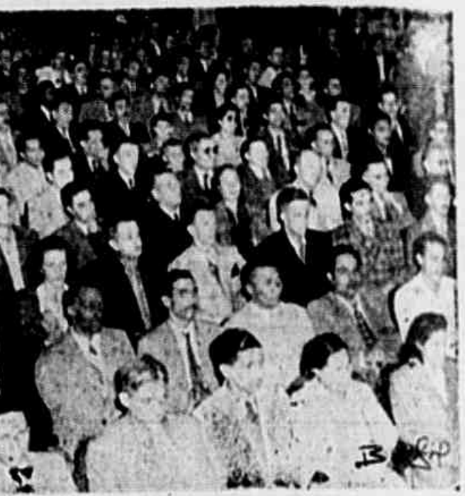
Um aspecto da reunião no Coliseu de Santos

personas interessadas. E a seguinte a síntese das atividades: Comissão de Assuntos de Educação — Reuniu-se ontem, às 20 horas. Ficou resolvido criar, de acordo com o regulamento interno a sub-comissão de assistência social, para apreciar as teses dessa especialidade. Os debates prosseguirão hoje às mesmas horas.