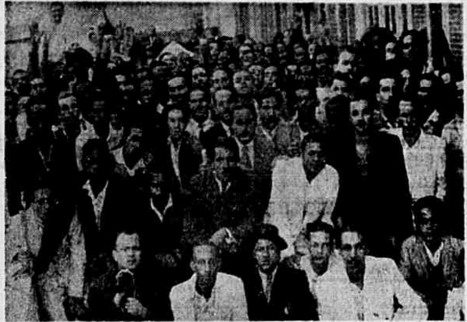
Vieram os metalúrgicos à nossa redação e aqui falaram aos redatores da "Tribuna Popular". Depois dirigiram-se em massa ao sindicato