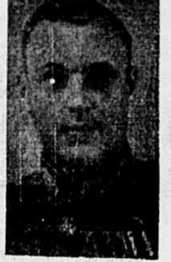
Zhukov e Rokossovskv, ontem condecorados por Montgomery