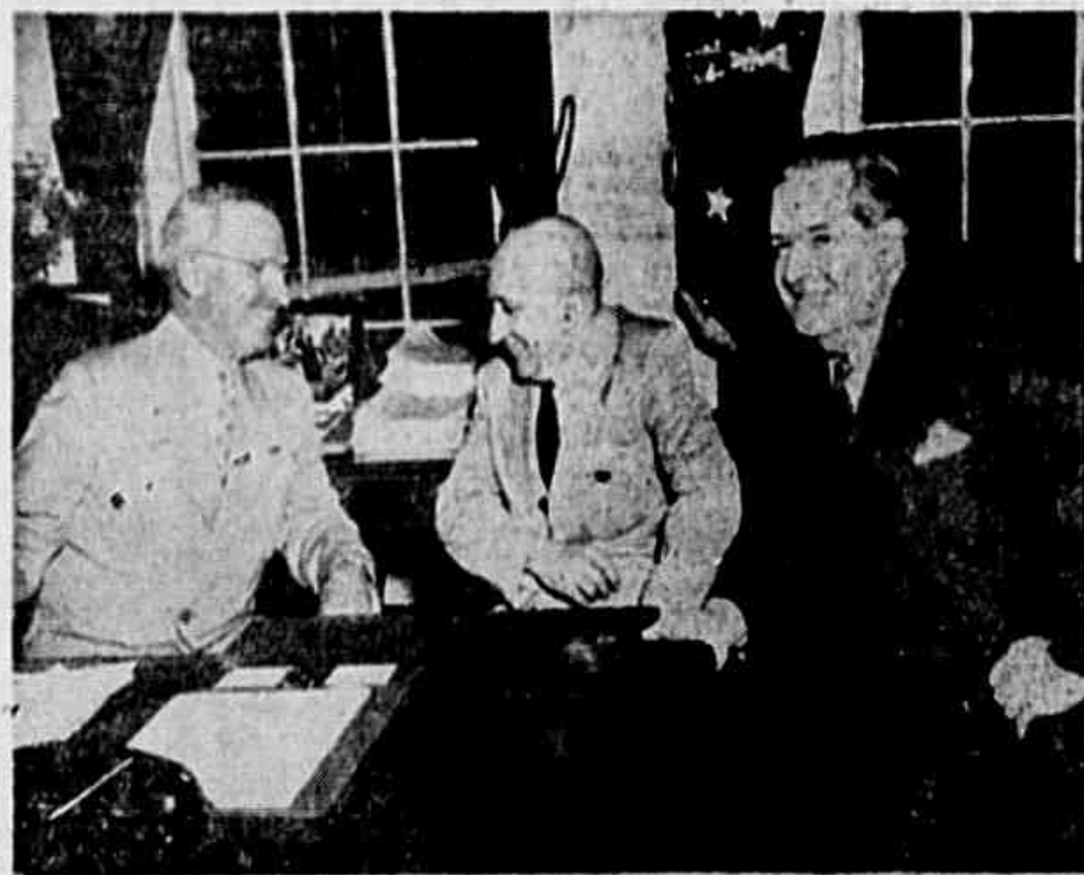
O Presidente Truman recebe na Casa Branca e visita do chanceler interino Leão Veloso, em companhia do embaixador Carlos Martins.

ANO I ★ Rio de Janeiro, Sexta-feira, 13 de Julho de 1945 ★ N.º 45