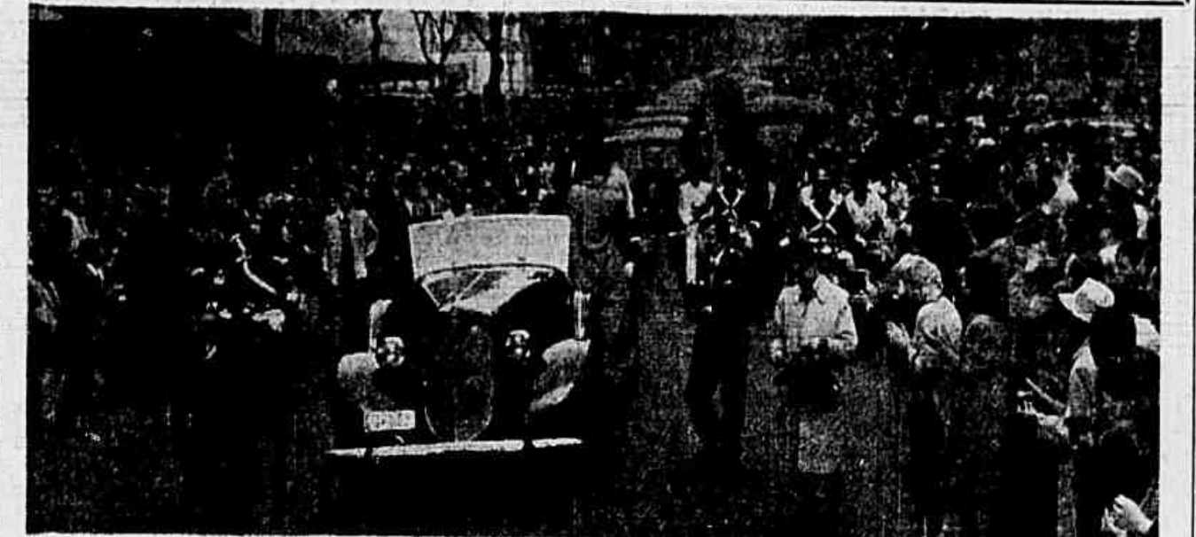
O mau tempo não impediu que o povo aclamasse com entusiasmo o general Mascarenhas de Moraes, ontem à tarde na Av. R. Branco

"O salutar impulso do povo repeliu o espirito nazista de dissociação que tentava combalir o expedicionário, desacreditar a participação na guerra e ridicularizar nossos preparativos"