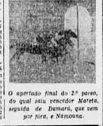
O apertado final do 2.º pareo, do qual saiu vencedor Mateta, seguida de Damara, que vem por fora, e Namouna.

AS NOSSAS INDICAÇÕES PAYAL — CAMGÊS — RATAPLAN CAYENA — ENFAS — GALIARDO ELEITA — CARIOCA — SAGIBEI AMORA — DARLBE — ANAPOLO FLA-FLU — SUPRISE — TRENOL BROADWAY — PANCHE — SOCRATES EXPEDICTUS — GLADIADOR — TUPAN FONTAINE — ARGENTINA — FAVINHA SALMON — ARK ROYAL — SOBRO