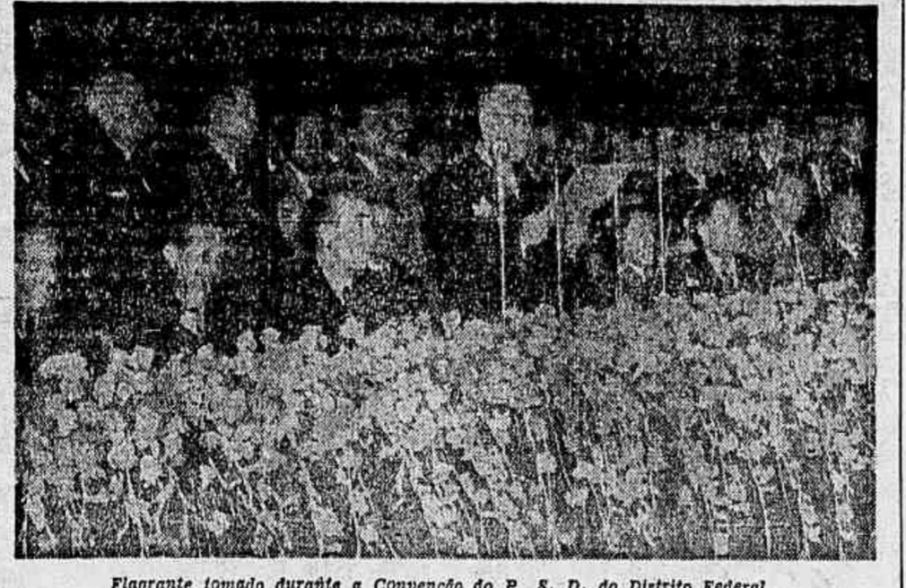
Flagrante tomado durante a Convenção do P. S. D. do Distrito Federal

HOMOLOGADA NA CONVENÇÃO DO P.S.D. A CANDIDATURA DO GENERAL APELO AS FORÇAS ARMADAS QUE GARANTAM A ORDEM, NECESSARIA AS ELEIÇÕES — AS BASES DO PROGRAMA