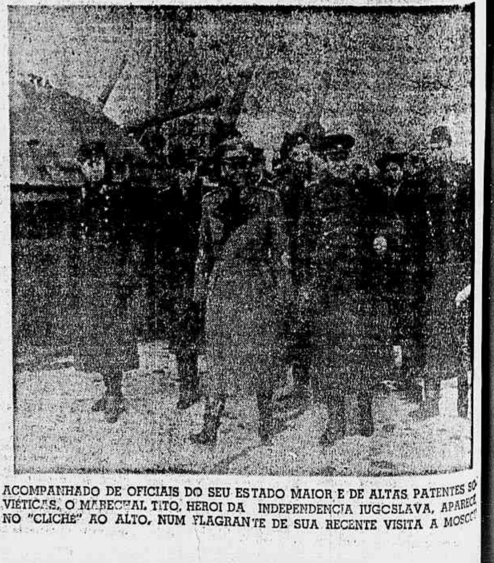
ACOMPANHADO DE OFICIAIS DO SEU ESTADO MAIOR E DE ALTAS PATENTES MILITARES, O MARECHAL TITO, HEROI DA INDEPENDENCIA IUGOSLAVA, APARECE NO "CLICHE" AO ALTO, NUM FLAGRANTE DE SUA RECENTE VISITA A MOSCOU