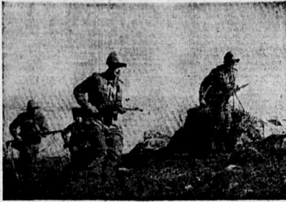
Estes soldados do Exército Vermelho participaram da libertação da Áustria