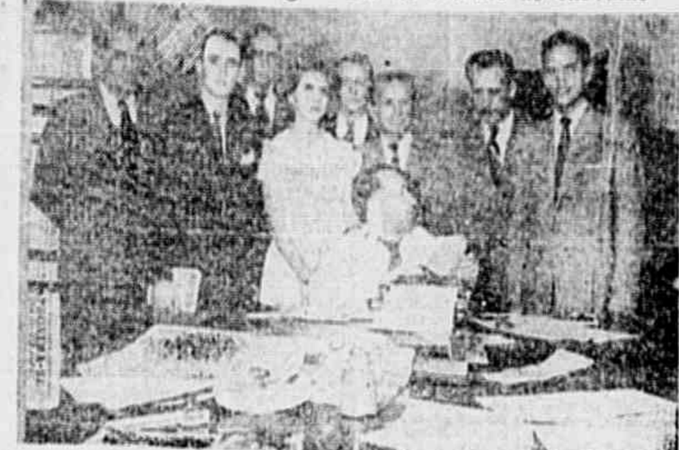
A gestora focaliza um aspecto da vida da redação da TRIBUNA POPULAR, de filiação ao Comitê Democrático Progressista de Vicente de Carvalho