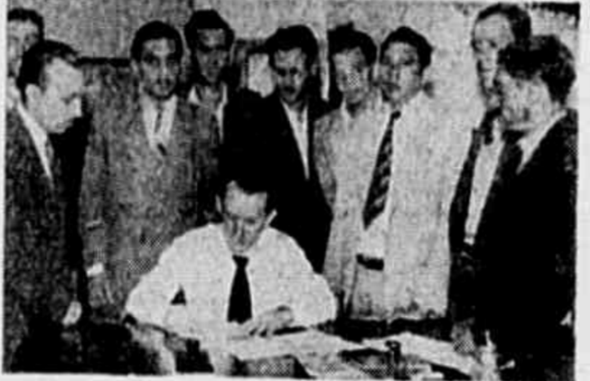
Membros da Sub-Comissão Democrática da Ilha dos Ferreiros

Nas oficinas da Ilha dos Ferreiros, na Ilha dos Ferreiros, há mais de 800 trabalhadores, entre metalúrgicos e profissionais de outras atividades. Por força do decreto-lei que os excluiu do benefício da sindicalização, eles não estão organizados sindicalmente. Por isso, empunham-se, agora, com todo o