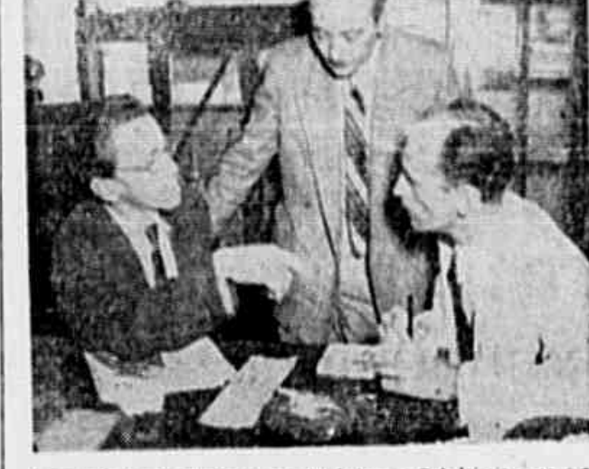
O presidente do Sindicato dos Barbeiros e Cabeleireiros ao ser entrevistado pela TRIBUNA POPULAR, em uma de suas reuniões com o chefe de um estabelecimento de barba.

pesam no nosso orçamento. Como poderemos viver com tão baixo salario?