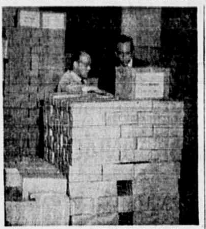
Já estão prontos quatro milhões de títulos eletrônicos, o que, sem dúvida, representa um esforço dos chefes e funcionários encarregados dessa tarefa. Na gravura acima vemos uma partilha de títulos preparada para seguir para o interior.