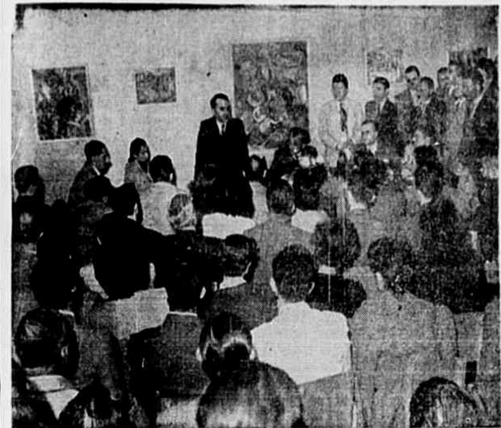
Luiz Carlos Prestes falando aos químicos industriais