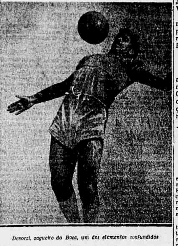
Desorzi, zagueiro do Boca, um dos elementos contundidos

De qualquer forma, o Botafogo ainda espera a palavra oficial do clube argentino. Existe a promessa do embaixador platino, que telegrafou para Buenos Aires pedindo urgência na resposta.