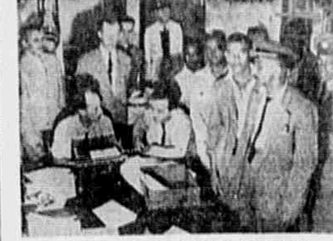
A comissão de motoristas e trocadores, num flagrante feito em nossa redação.

O sindicato abrange como similiares: manicures, pedicures e massagistas faciais.