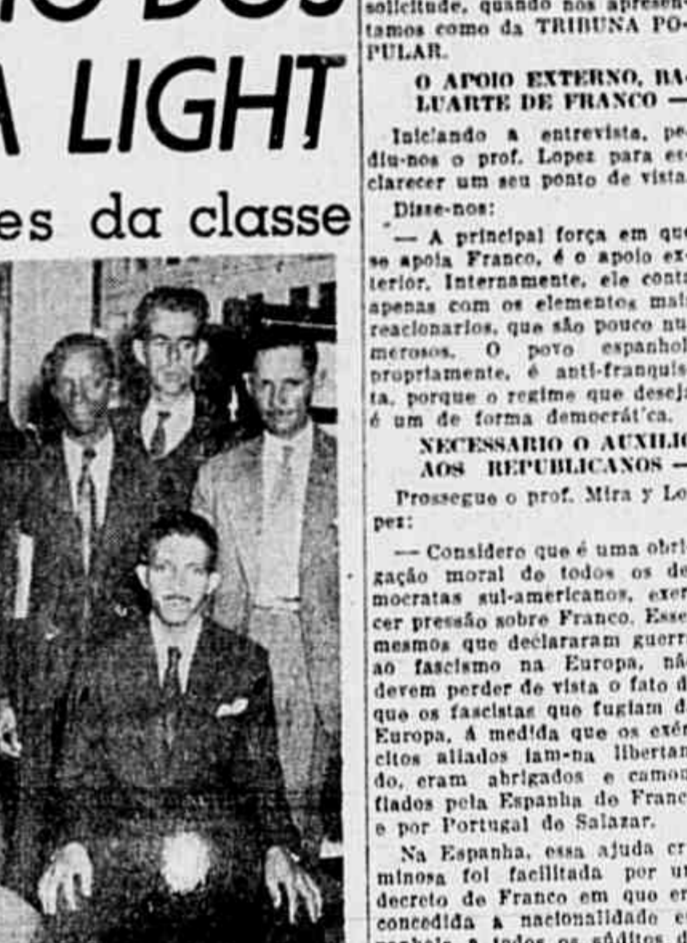
Os trabalhadores da Light num flagrante tomado em nossa redação

blema de forma esteril, sem apresentarem soluções. Já através de certa imprensa, já nas horas de trabalho — usando a velha técnica do "inglês" do "judet", etc. — já tão nosso conhecido!