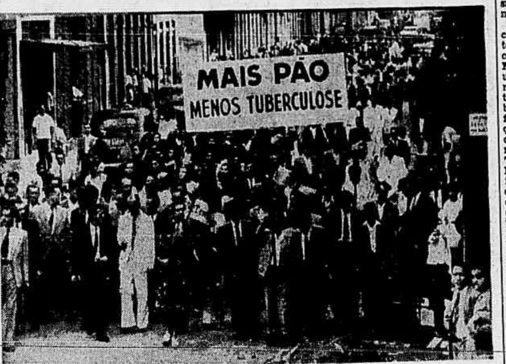
Os manifestantes ontem à tarde na cidade

AUMENTO DE 32% INICIAL, A PARTIR DE 1º DE MAIO - CONSERVADOS OS DIVERSOS ABONOS JA CONSEGUIDOS - FOI O MAIOR DIA NA JUSTIÇA DO TRABALHO - FALOU UM REPRESENTANTE DA M. U. T. O povo carioca presenciou ontem à tarde, em frente à Justiça do Trabalho, na Avenida Nilo Peçanha, um acontecimento inédito e que bem revela o alto grau de compreensão dos operários no momento que atravessamos. Mais de 4.000 trabalhadores na indústria de Fumo vieram, em massa, assistir pacificamente ao julgamento do dissídio coletivo suscitado pelo seu Sindicato contra o da Indústria de Fumo. Empunhando bandeiras, cartazes, em que pediam mais pão e menos tuberculose, em que solicitavam, dentro da ordem, justiça para a causa comum, os trabalhadores ouviram todo o desenrolar do julgamento através de um microfone instalado na sala de audiência do Conselho Regional do Trabalho, concessão essa que conquistou a simpatia da multidão.