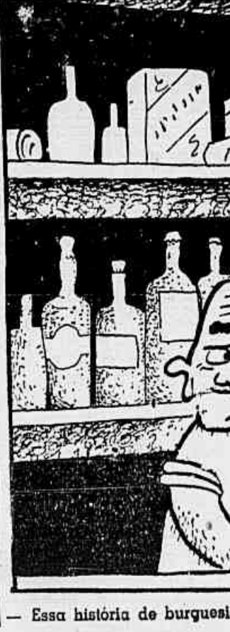
Essa história de burguesia progressista vai prejudicar os negócios de cambio n-gro...