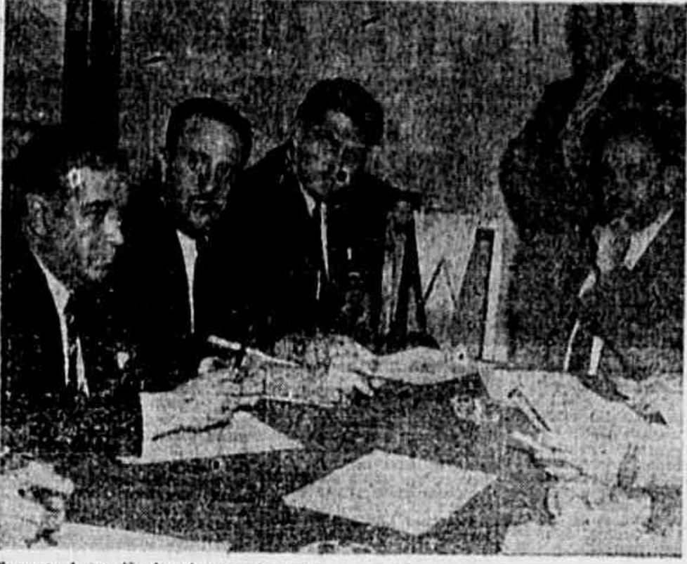
Viagante da reunião de ontem na F. M. F., quando foram aprovados os artigos finais do Regulamento geral da entidade

SERÁ FEITA A CLASSIFICAÇÃO DOS JUIZES No campeonato oficial, a partir da primeira rodada, o Departamento de Árbitros, de acôrdo com uma idéa que parece vitoriosa, fará a classificação dos juizes. A contagem de pontos, para efeito de colocação, será feita pelas vitórias ou aceitações por parte dos clubes. Se o juiz for aceito pelos dois clubes, ganhará um determinado número de pontos. Na hipótese de ser recusado por um e aceito por outro, nada ganhará ou perderá. Rejeitado pelos dois, então terá um déficit de pontos equivalente ao da aceitação integral. Ao fim do turno, serão rebavados de categoria aqueles que tiverem pontos abaixo de um nível a ser fixado.