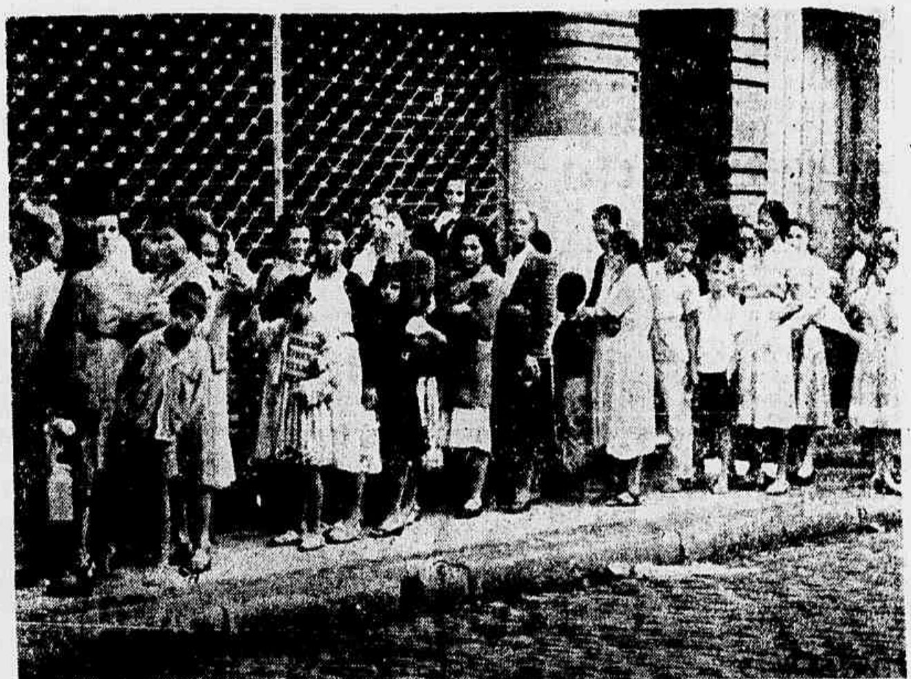
PELAS ESTATÍSTICAS DO MINISTÉRIO DA AGRICULTURA, EXISTE NO BRASIL UM BOI PARA CADA HABITANTE. MAS O CAROÇA TEM ENCONTRADO OS AÇOUGUES VAZIOS, OU, NO DIA DE GRANDE SORTE, PRECISA MADRUGAR NA PIA PARA DEFENDER UMA RAÇÃO DE DOIS QUILOS PARA A FAMÍLIA.

REAVLIAÇÃO DOS ATIVOS: Nacionalismo e Entreguismo Travarão Batalha No Congresso (3.ª página)