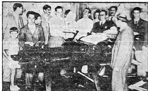
Aspectos da oficina d'«A Voz do Povo», semanário editado pelos camaradas do C. M. de Caxias, no Rio Grande do Sul. A fotografia foi tomada há cerca de seis meses, quando a impressora manual que se vê na foto lançava o primeiro numero do jornal por entre aclamações do pessoal da direção, redação, oficina e dos dirigentes municipais e estaduais do PCB presentes.