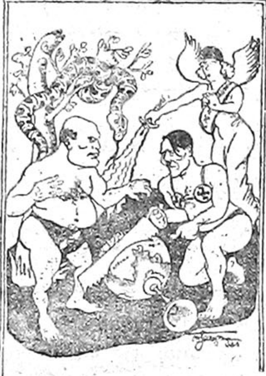
Hitler a Mussolini: Dividamos esta maçã, meu Benitozinho.