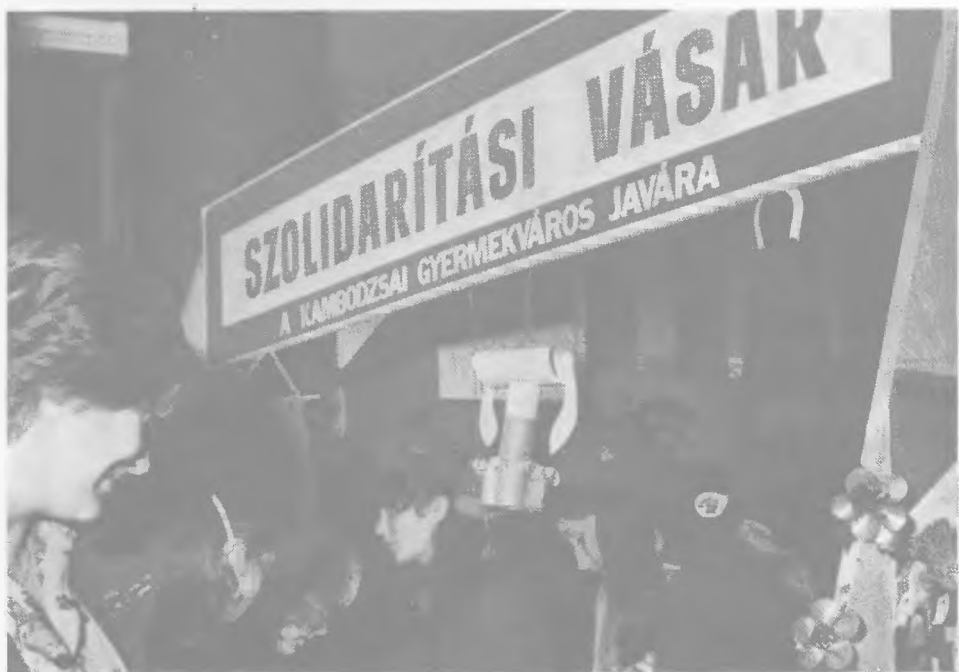
A tanácskozás szünetében (III.)