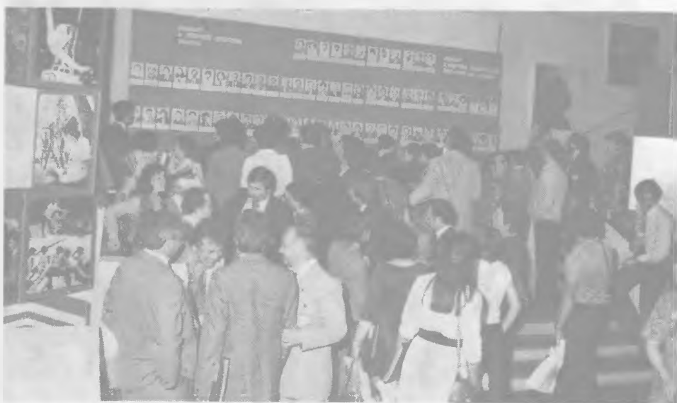
A tanácskozás szünetében (I.)