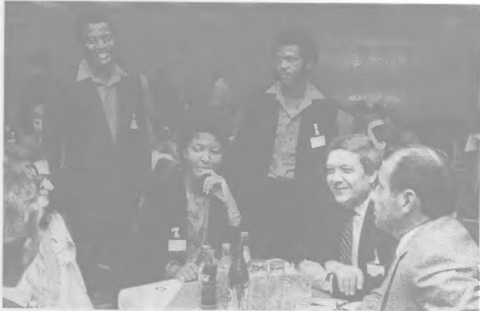
A tanácskozás szünetében (IV.)