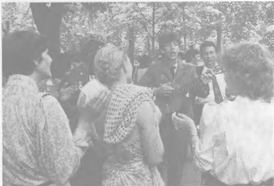
A tanácskozás szünetében (II.)