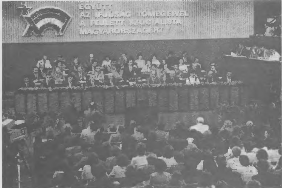
A kongresszus megnyitója