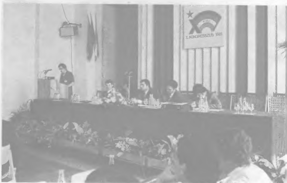
Egyetemi és főiskolai hallgatók szekciójának ülése