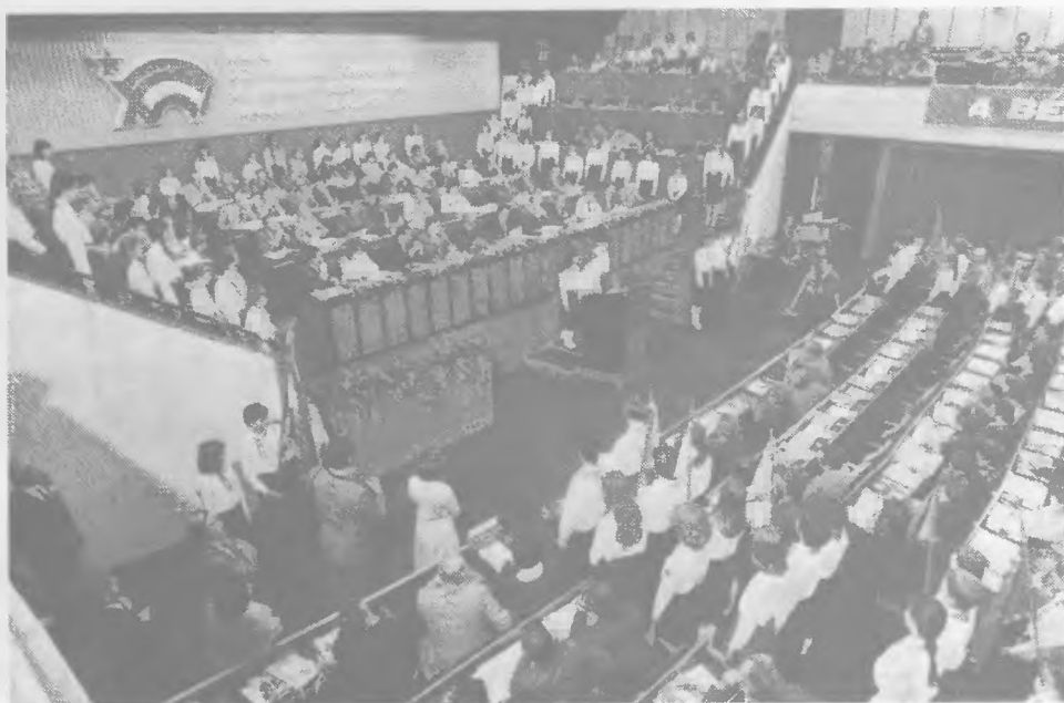
Kisdobosok és uttörők köszöntik a kongresszust