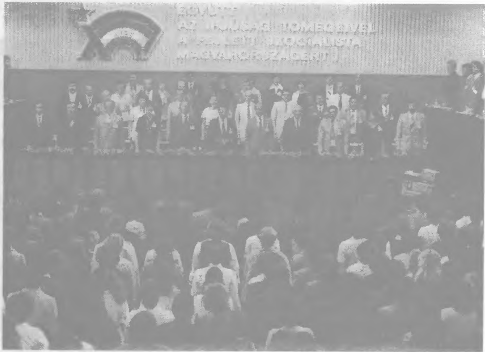
A kongresszus a DIVSZ-induló hangjaival zárult