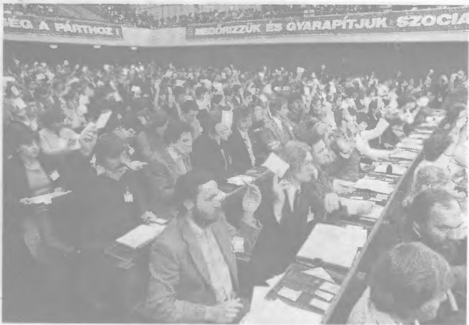
Szavaznak a küldöttek