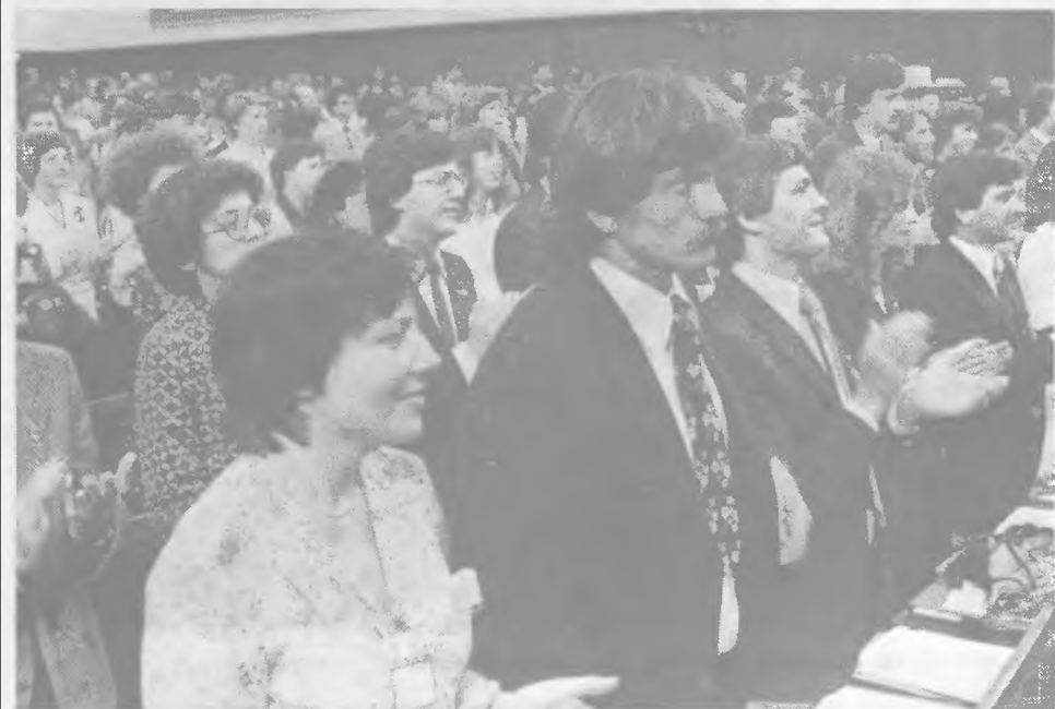
A kongresszus küldöttei