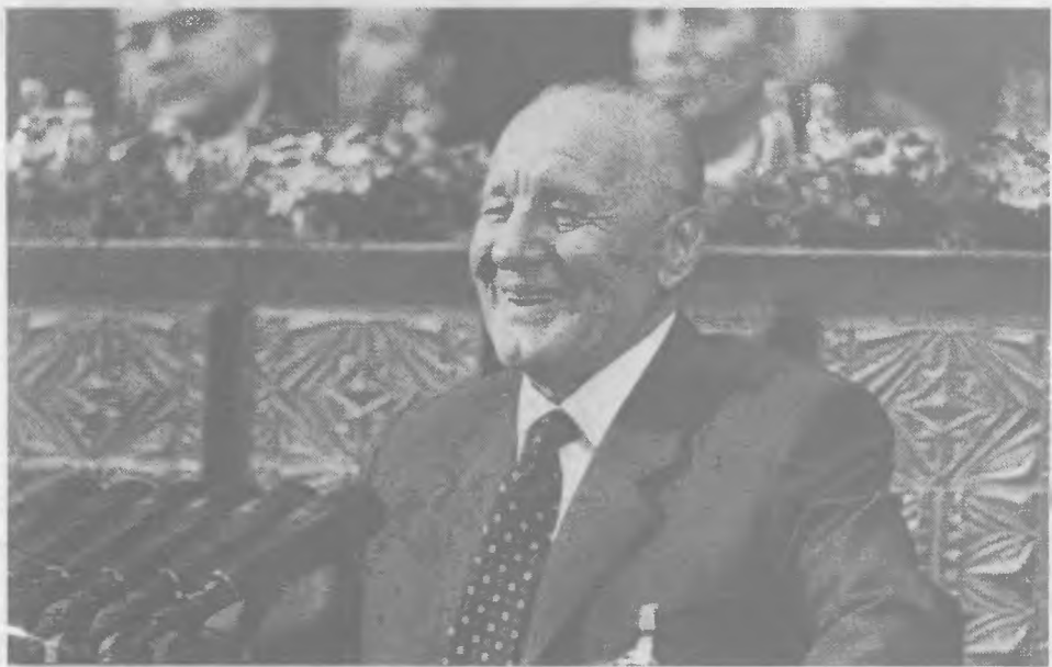
Kádár János, az MSZMP KB első titkára a szónoki emelvényen