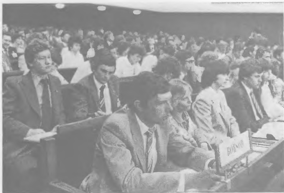
Megyei küldöttcsoportok a kongresszusi teremben