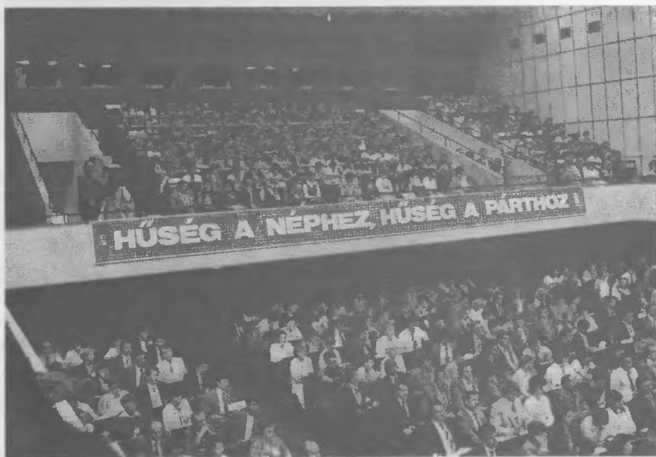
Ülésezik a KISZ X. kongresszusa