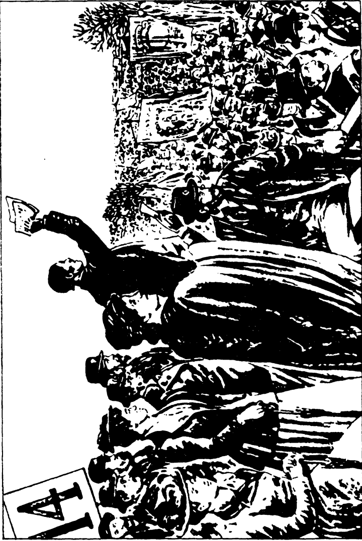
Az 1892-es májusi tüntetés a londoni Hyde Parkban. A 14. számú emelvényen foglalt helyet Engels (a „Daily Graphic”-ben megjelent rajz után)