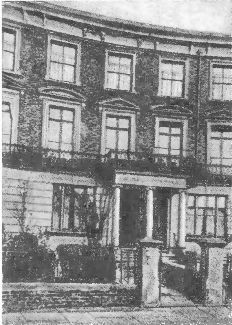
A ház, amelyben Marx 1875 márciusától élete végéig lakott (London. 41. Maitland Park Road)