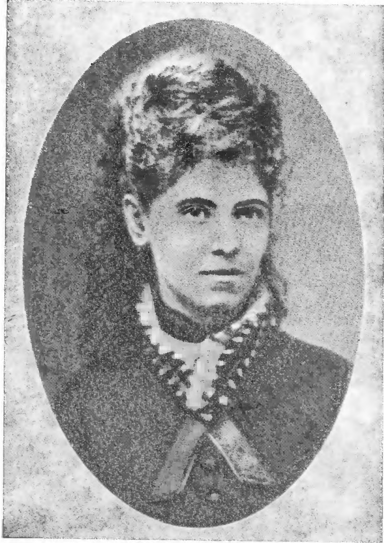
Laura, Marx leánya