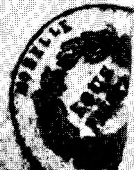
Marx 1848 márciusában kiállított útlevele (harmadik oldal)