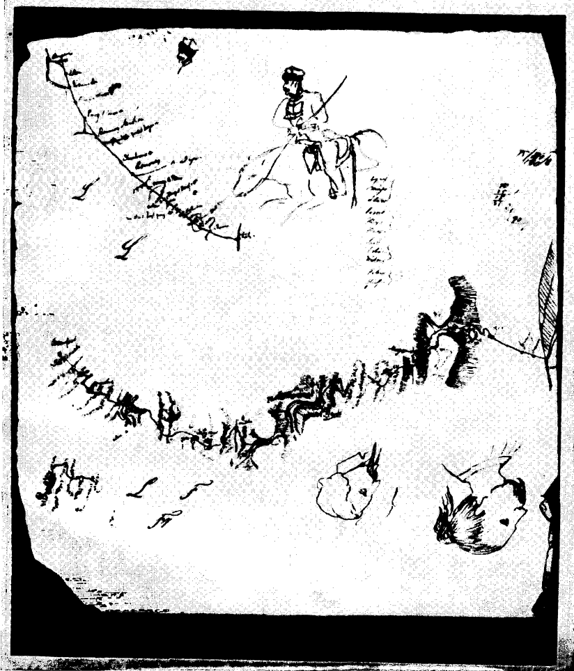
Engels térképvázlatai franciaországi és svájci gyalogútjáról 421