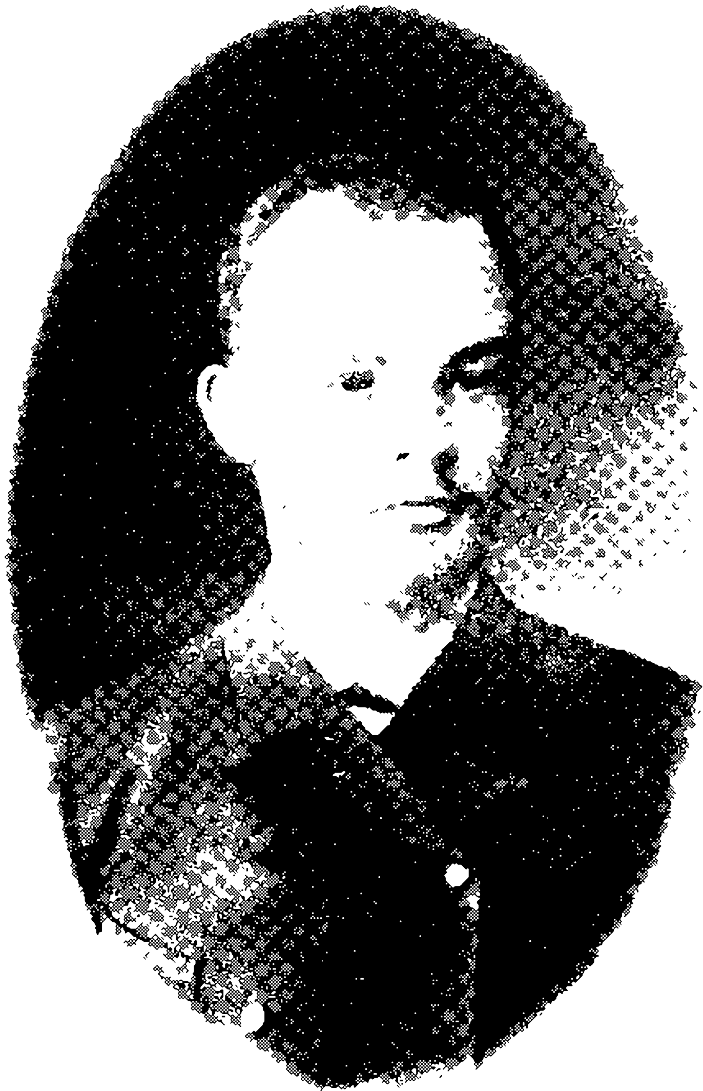
V. I. LENIN 1890—1891