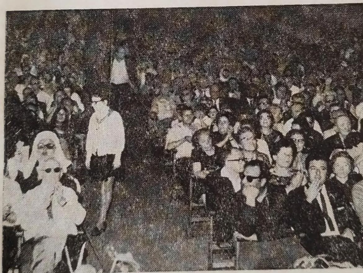
חלק מקהל המשתתפים בעצרת