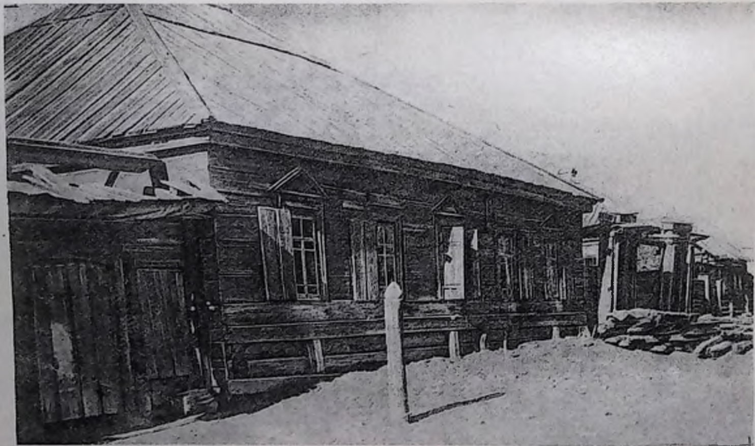
Къщата в село Шушенское, в която е живял по време на заточението си В. И. Ленин. Крайните два прозореца вляво са прозорците на стаята на Ленин.