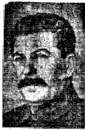
Великият полковникъ на Храбрата Червена Армия КОСКОФЪ ВИСАРИОНОВИЧЪ СТАЛИНЪ

Очистим българскую землю от гитлеровской нечисти! Поможем болгарскому народу вернуться на путь исторической дружбы с великим русским народом освободителем!